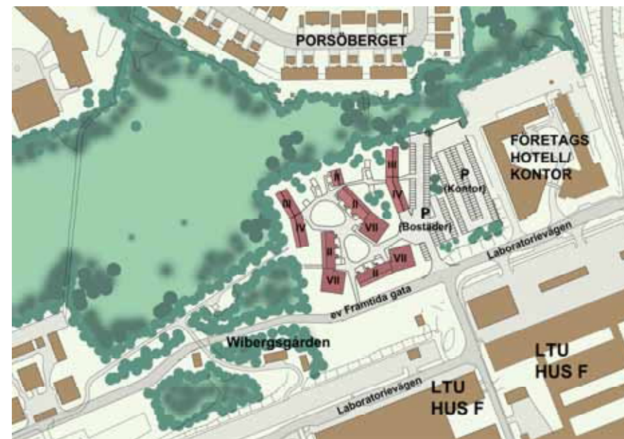
ILLUSTRATION, MAXIMALT UTNYTTJANDE AV BYGGRÄTT