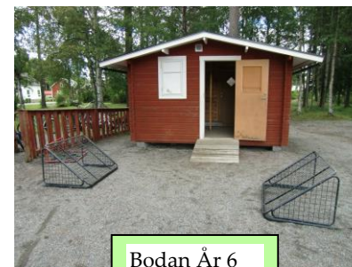
Bodan År 6