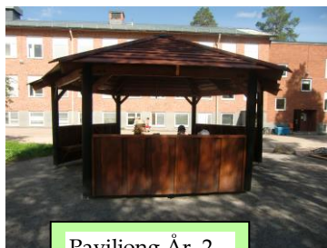
Paviljong År 2