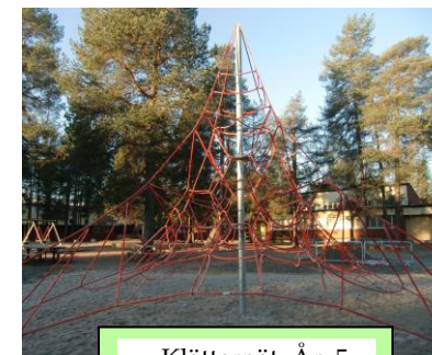
Klätternät År 5