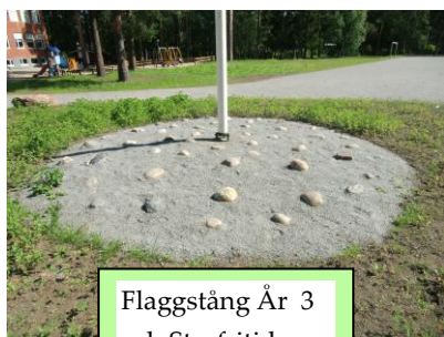
Flaggstång År 3 och Storfritids