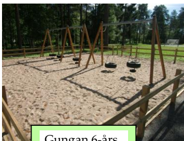
Gungan 6-års och Lillfritids