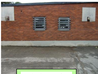
Basketkorgar år 4

Uppsamlingsplatser för respektive klasser vid brandlarm. Speciallärare, resurspedagoger, lokalvårdare och bespisningspersonal samlas vid flaggstången. Madaelever samlas utanför gymnastiksalen.