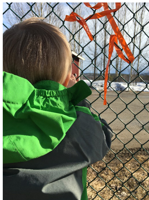
Illustration från detaljplanen för Del av Lulsundsberget.