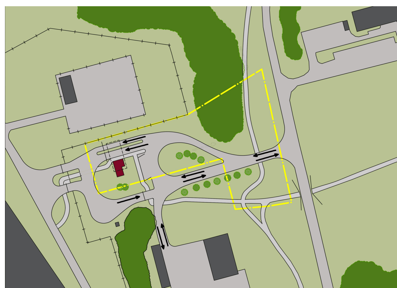
ILLUSTRATION (ej skalenlig)