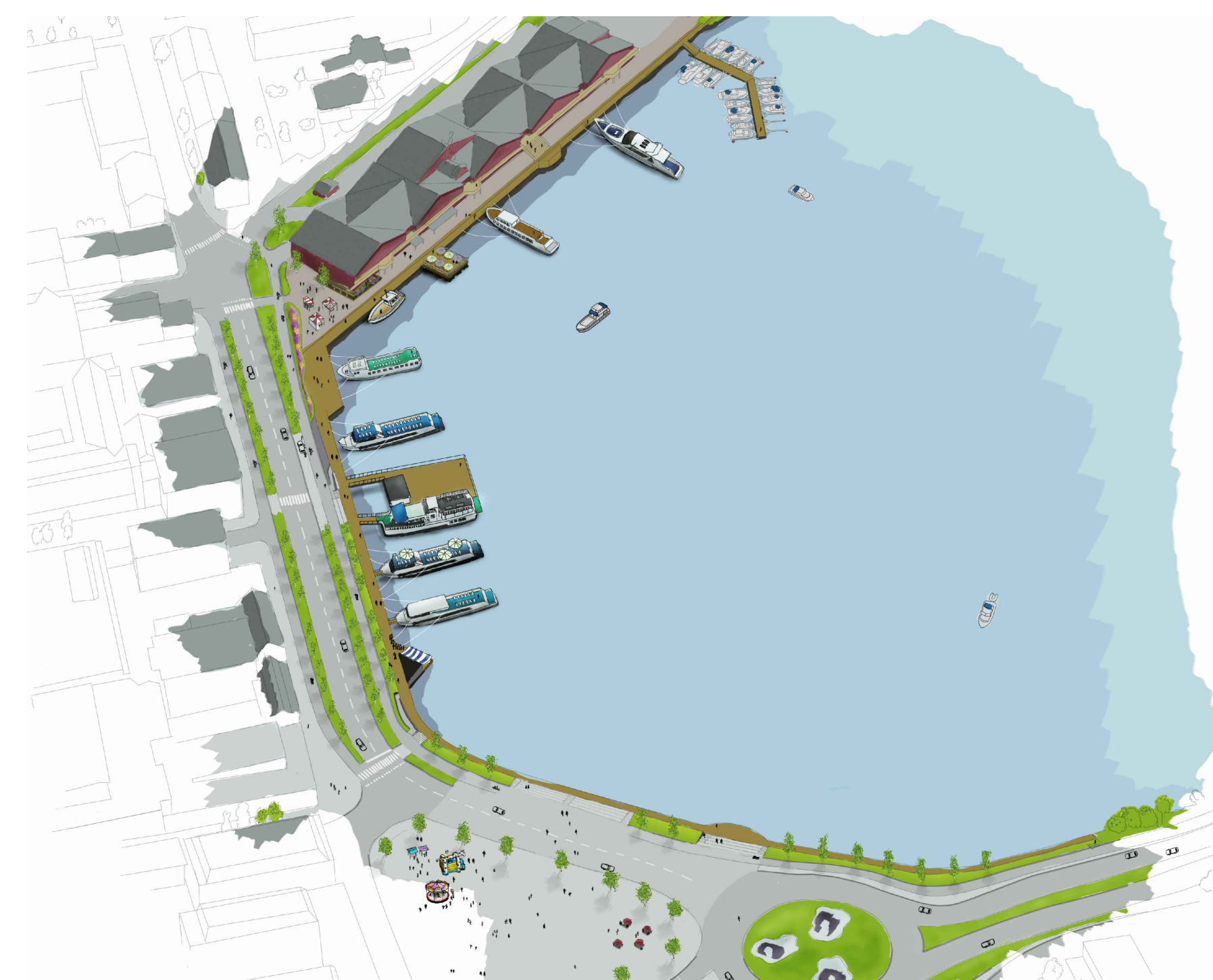
ILLUSTRATION ÖVER HAMNOMRÅDET (ej skalenlig)

Illustration till vänster är framtagen i samband med kommunens målbildsarbete för Norra hamn. Observera att detta är ett scenario som detaljplanen kan medge, och att det kan komma att se annorlunda ut. Detaljplanen innebär inga förändringar för kringliggande gator.