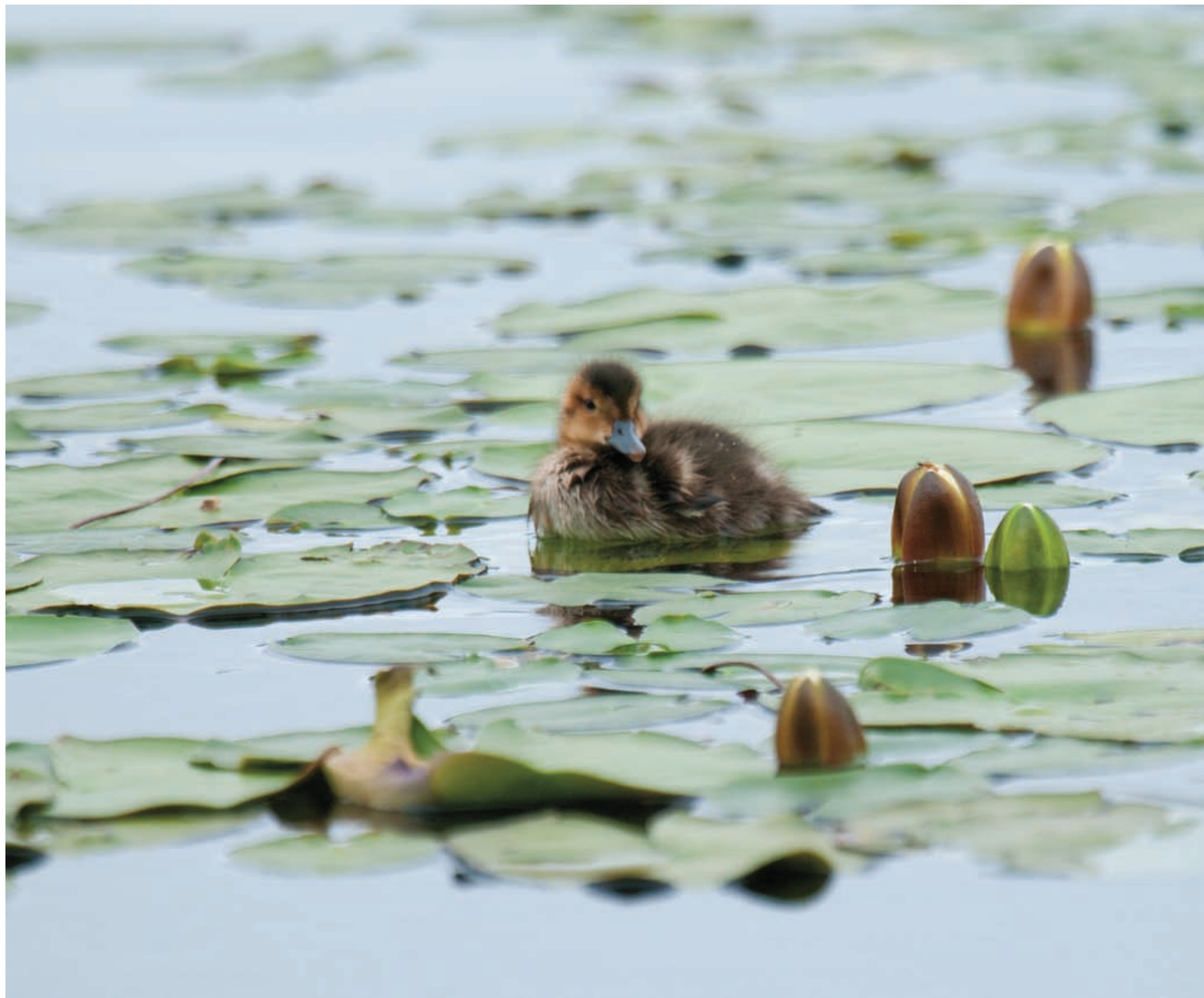
Andunge bland näckrosblommor. Duckling among water lily flowers.