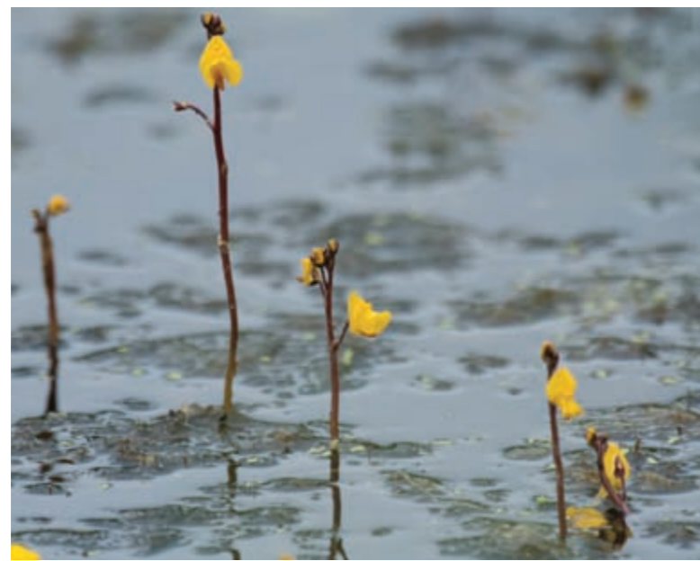
Vattenbläddra. Greater bladderwort.