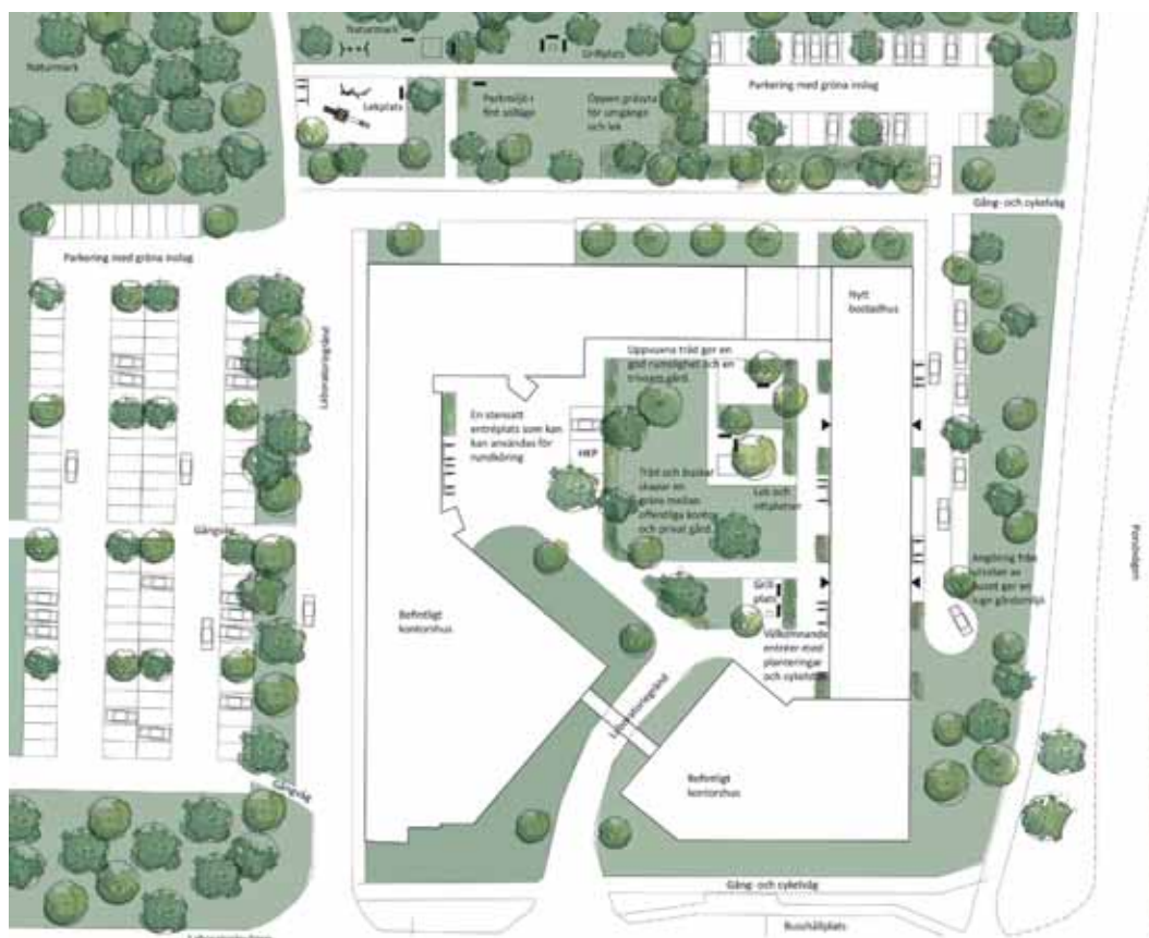
Illustration Scenario I: Kontorsbaracken rivs och ersätts med sexvåningsbyggnad för studentbostäder.

På fastighetens innergård finns goda möjligheter att anordna friytor, se illustrationer nästa sida. Utemiljöerna kan samnyttjas då tidpunkt för att använda exempelvis uteplatser ofta skiljer sig åt mellan bostäder och arbetsplats. Närmaste offentliga lek miljö finns vid Porsöcentrum och vid Teknikens hus. Naturmiljö med goda möjligheter till rekreation finns i skogsområdet norr om planområdet.