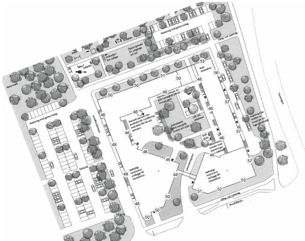
Bullerberäkning, ekvivalent ljudnivå, dBA, högsta värde på någon våning. Bernström akustik 2015-01-28.

Trafikflöden har hämtats från kommunens trafikflödeskarta 2013. I beräkningen har trafiksiffrorna räknats upp med ca 10 %. Hänsyn har tagits till samtliga större