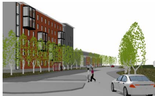
Förslag. Vy från Mjölkuddsvägen mot Tuna