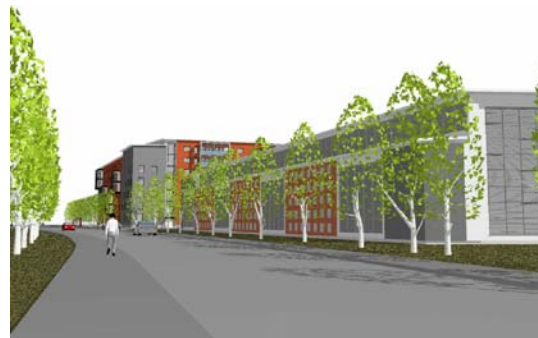
Förslag. Vy från Mjölkuddsvägen mot Mjölkudden centrum