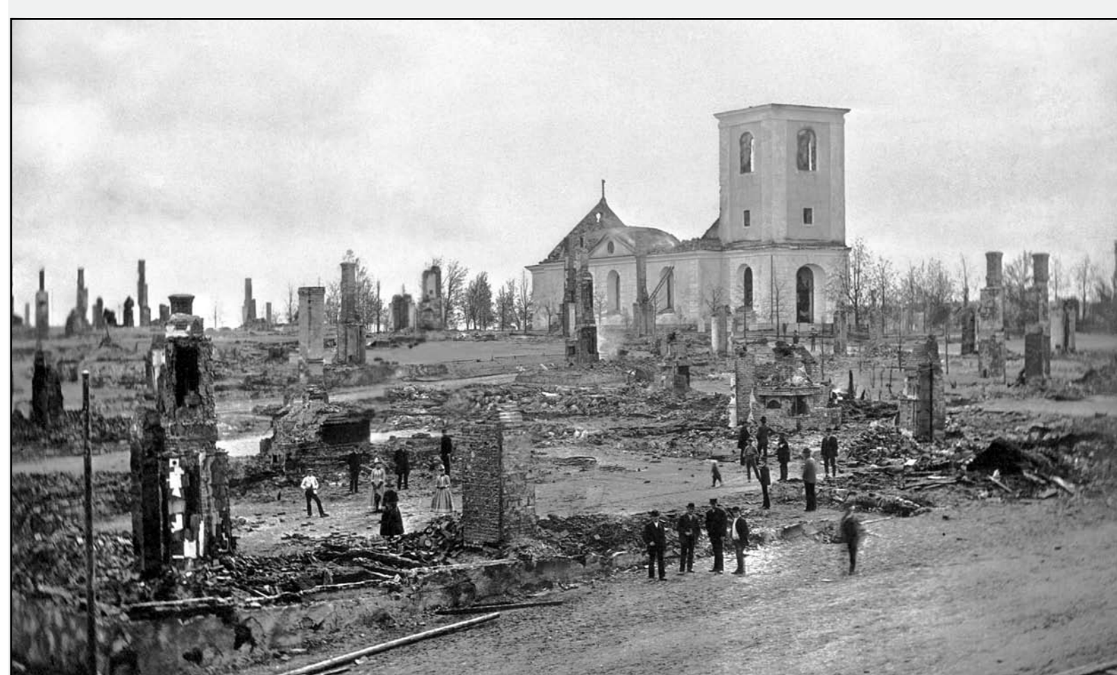
Efter stadsbranden 1887 återstod endast husgrunder och skorstenar där elden härjat.