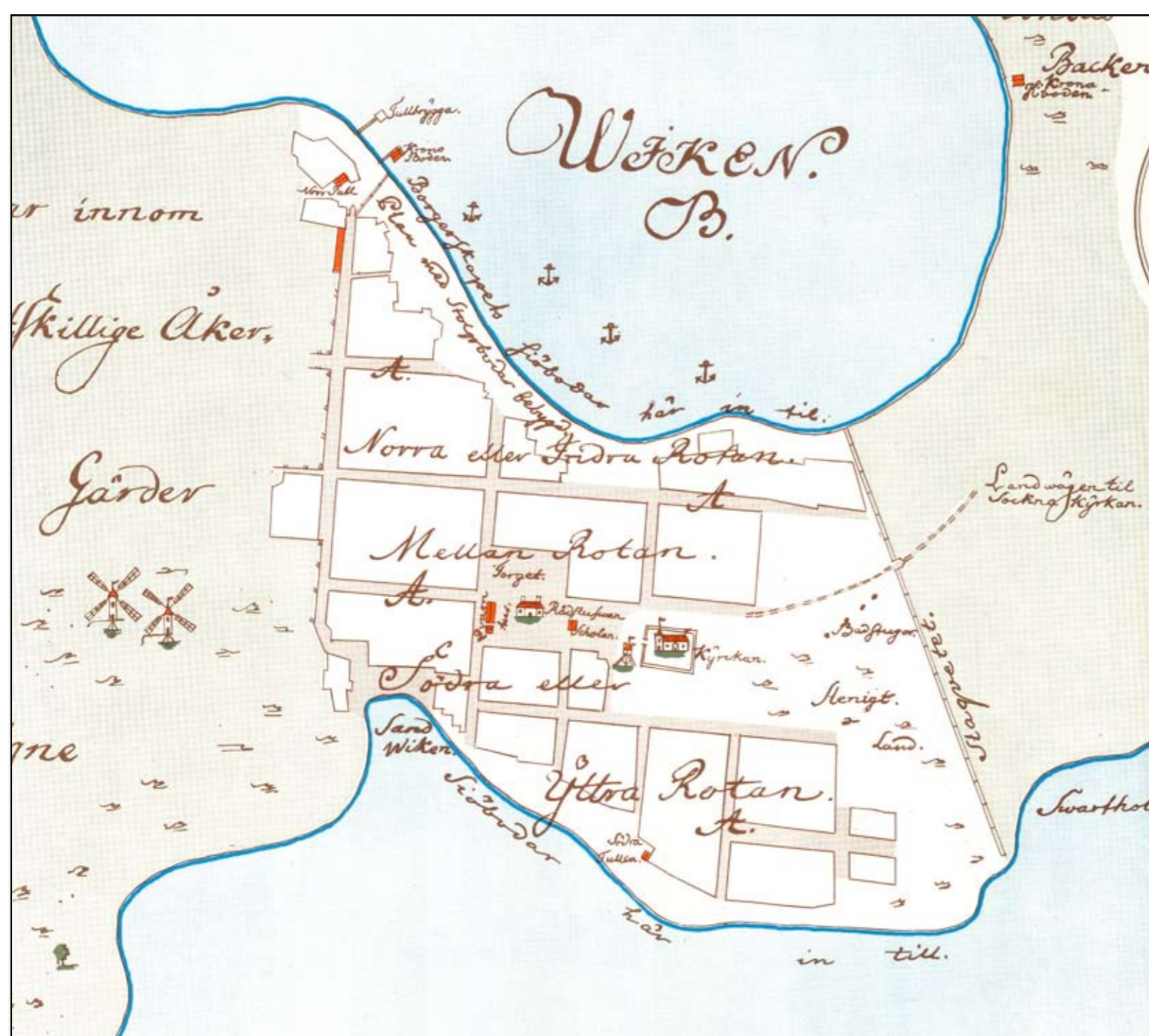
Luleå stad år 1750. Karta Esaias Hackzell/utgiven år 1967 av Luleå kommuns Stadsingenjörskontor.