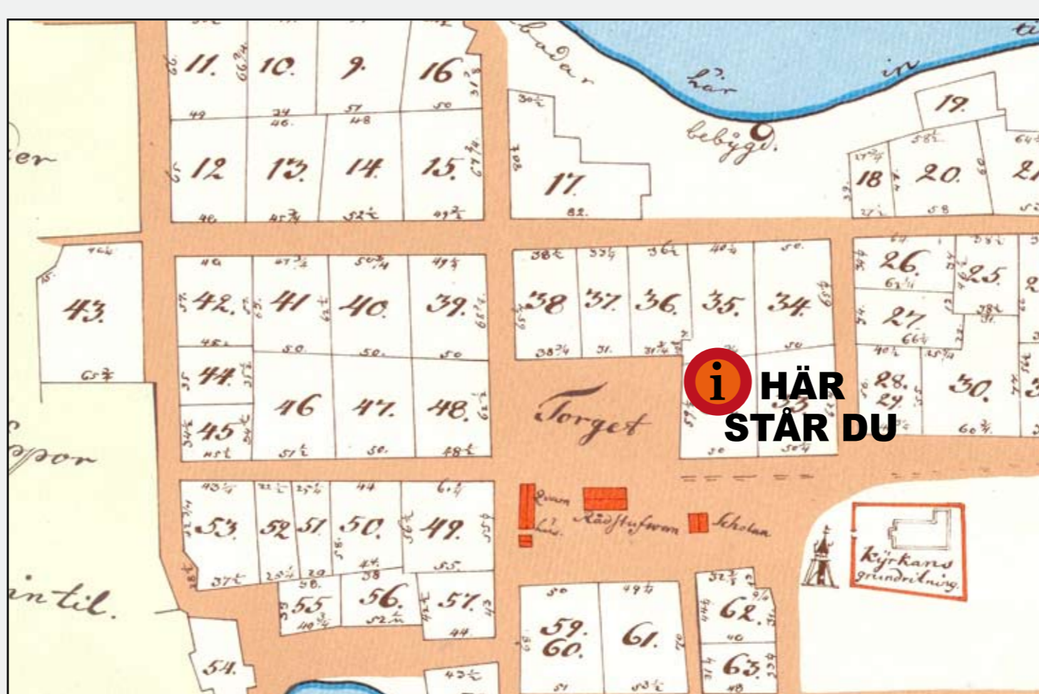
Kvartersindelning och stadens centrum år 1750. Karta Esaias Hackzell/utgiven år 1971 av Luleå kommuns Exploateringskontor.