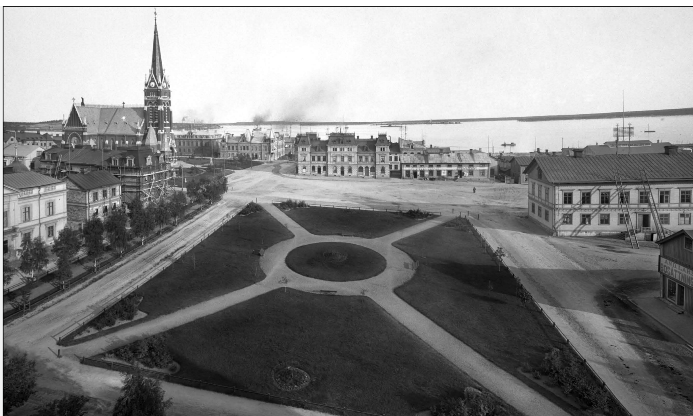
Stadsparken i början av 1900-talet.