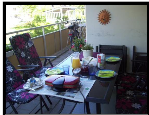
Lite av sommarens skörd & vad passar inte bättre till lunch än nygräddade våfflor med sylt & grädde, en härlig sommardag .