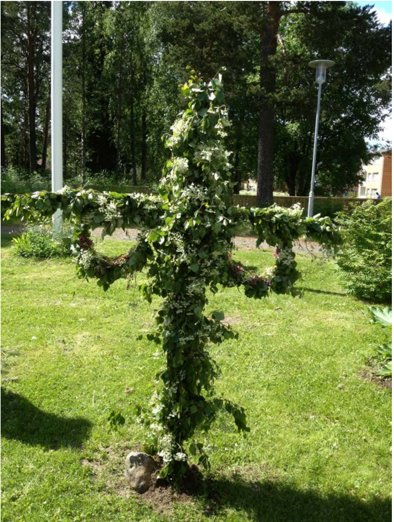
Titta så fin midsommarstång våra sommar flickor och pojkar gjorde till midsommar.