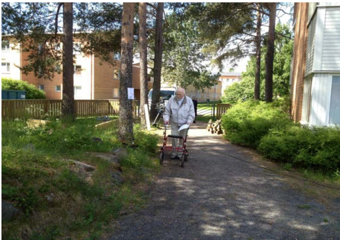
Ture från Drängvägen löste galant frågorna i tipsrundan.