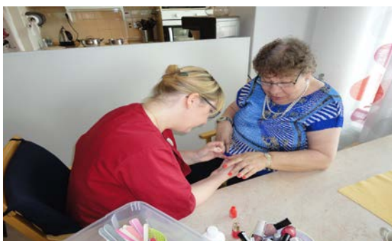
Här är det Guns tur att bli fin om naglarna