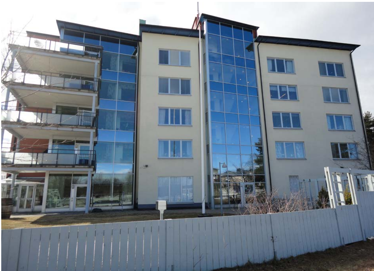
Solbackens baksida fotograferat en vacker vårdag i april.

På Solbacken rullar livet vidare och jag tror att ljuset och vädret piggar upp både personal och kunder vilket leder till ett allmänt välmående.