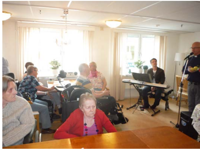
Bergnäs kyrkan på besök