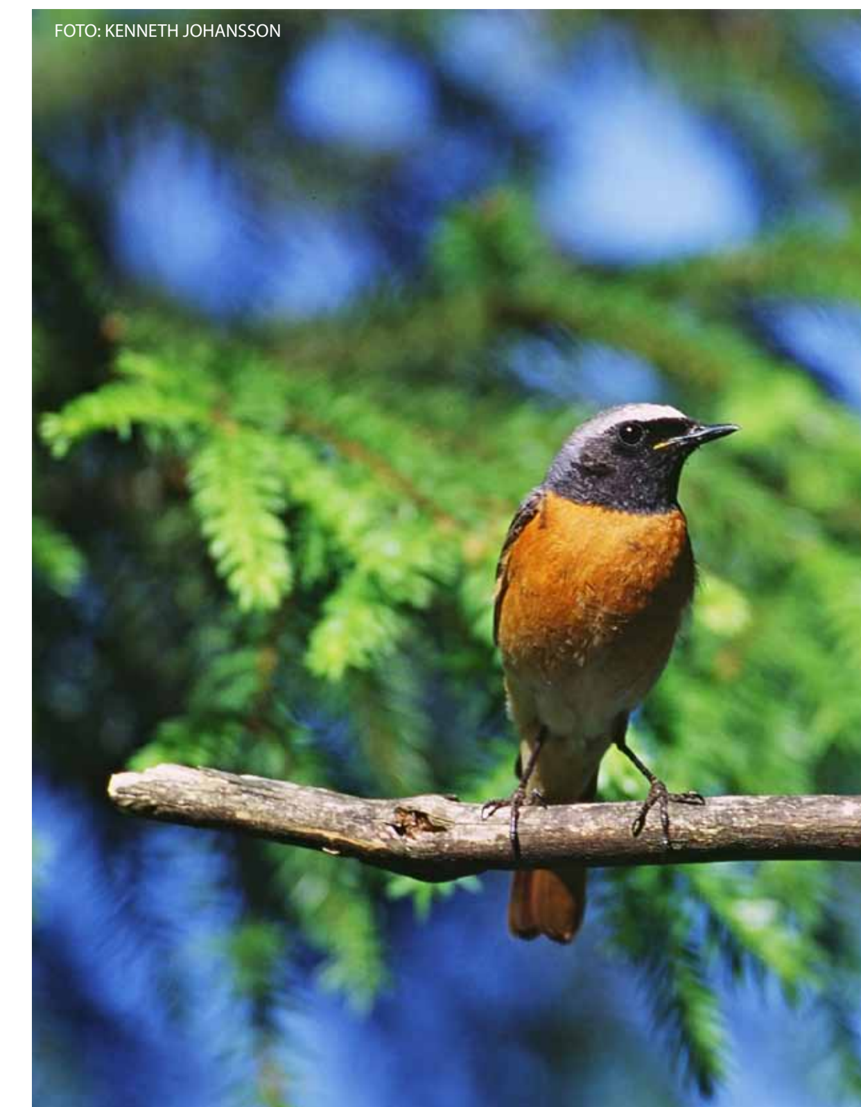
Rödstarten sjunger på vårmorgnarna. The Redstart sings on spring mornings.