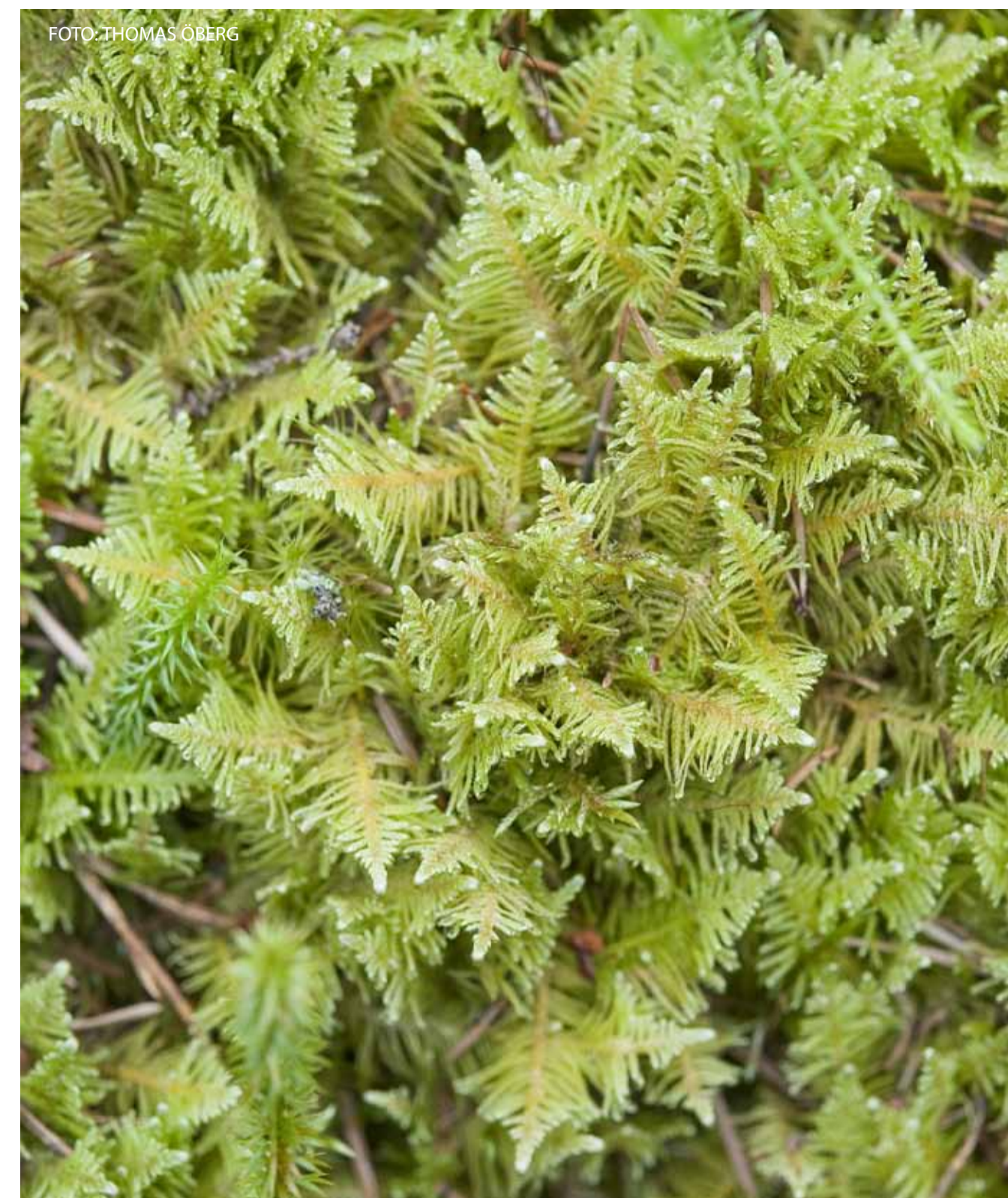
Den vackra kammossan. The beautiful Plume Moss.