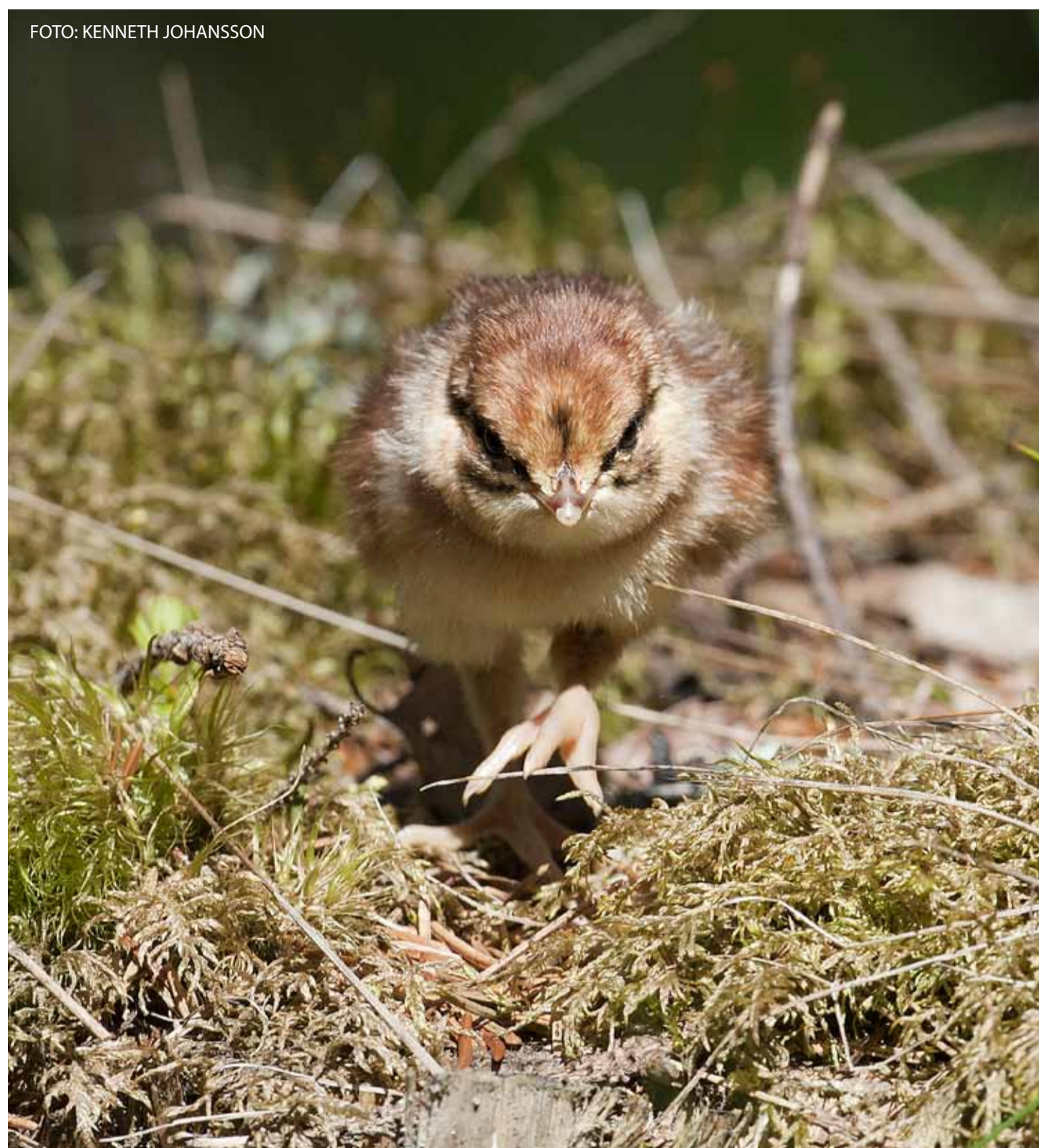
Järpkycklingarna lämnar boet när äggen är kläckta. Hazel grouse chicks leave the nest once the eggs have hatched.