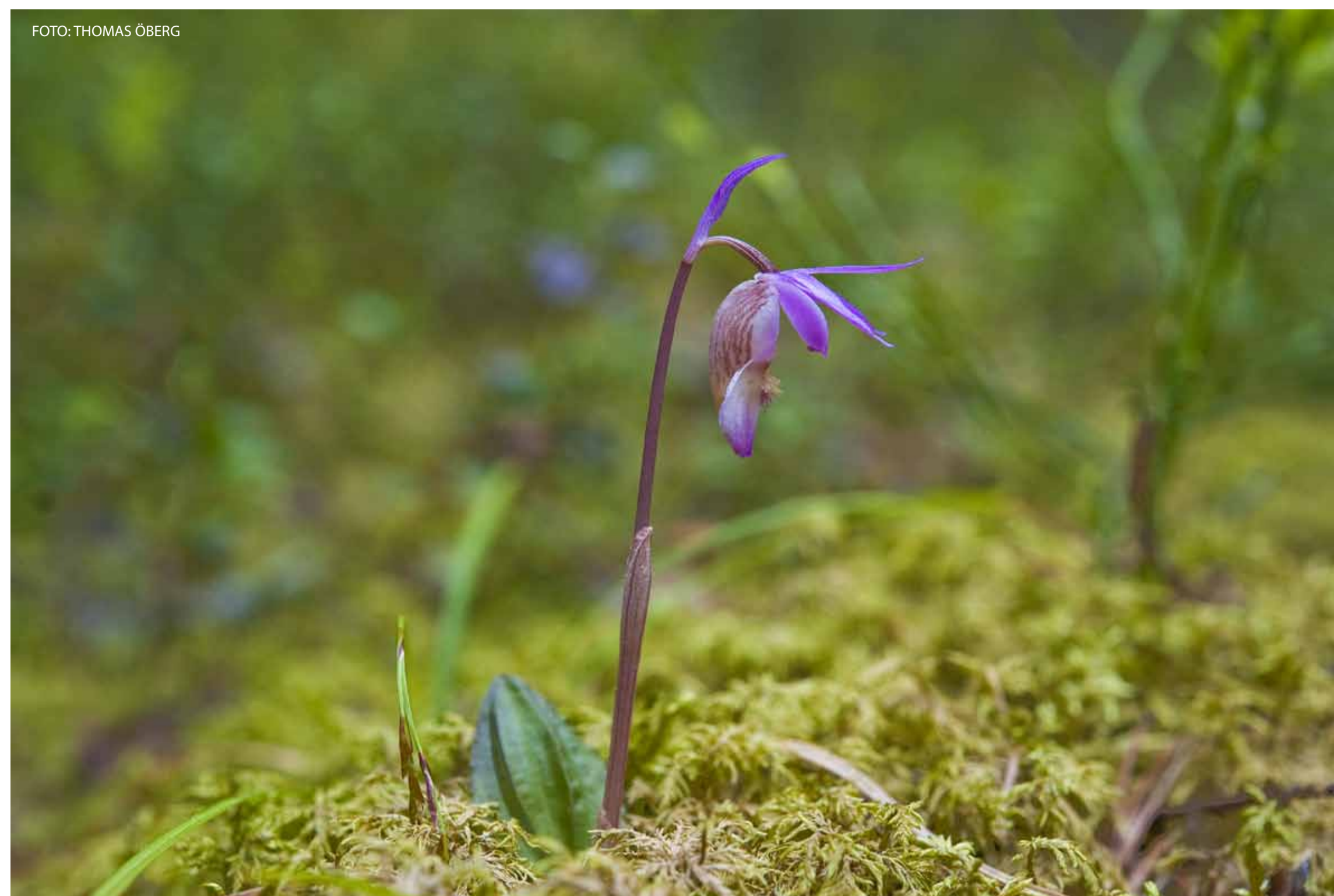
Den lilla orkidén norna blommar i maj-juni. The Fairy-Slipper is a small orchid that blooms in May-June.