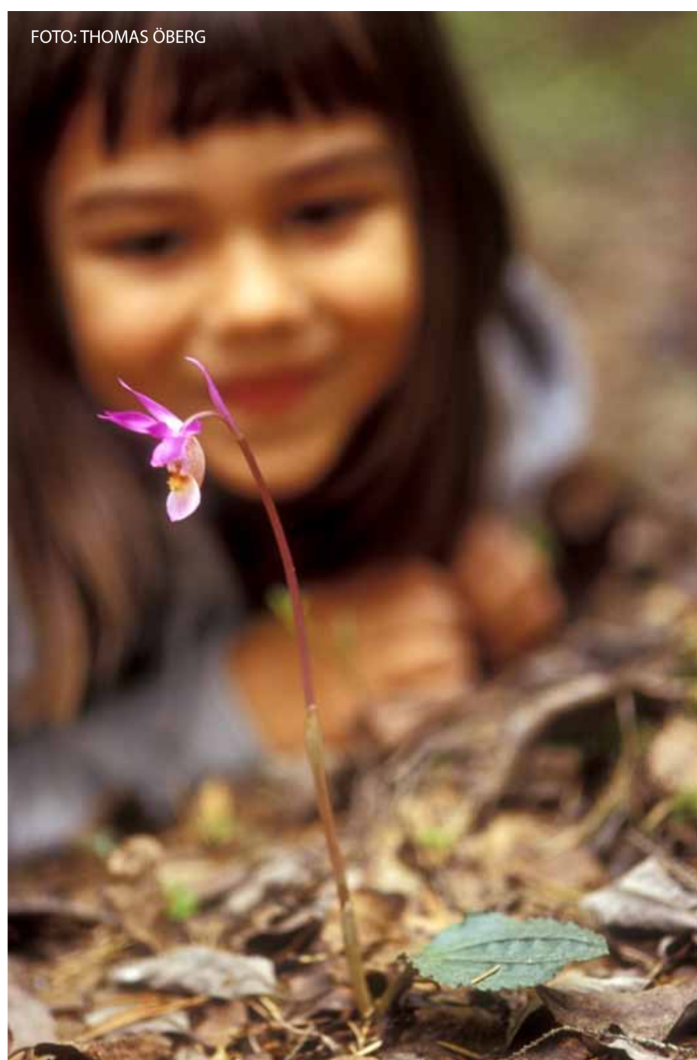
Vandra varsamt i nornaskogen. Tread carefully in the Fairy-Slipper woods!