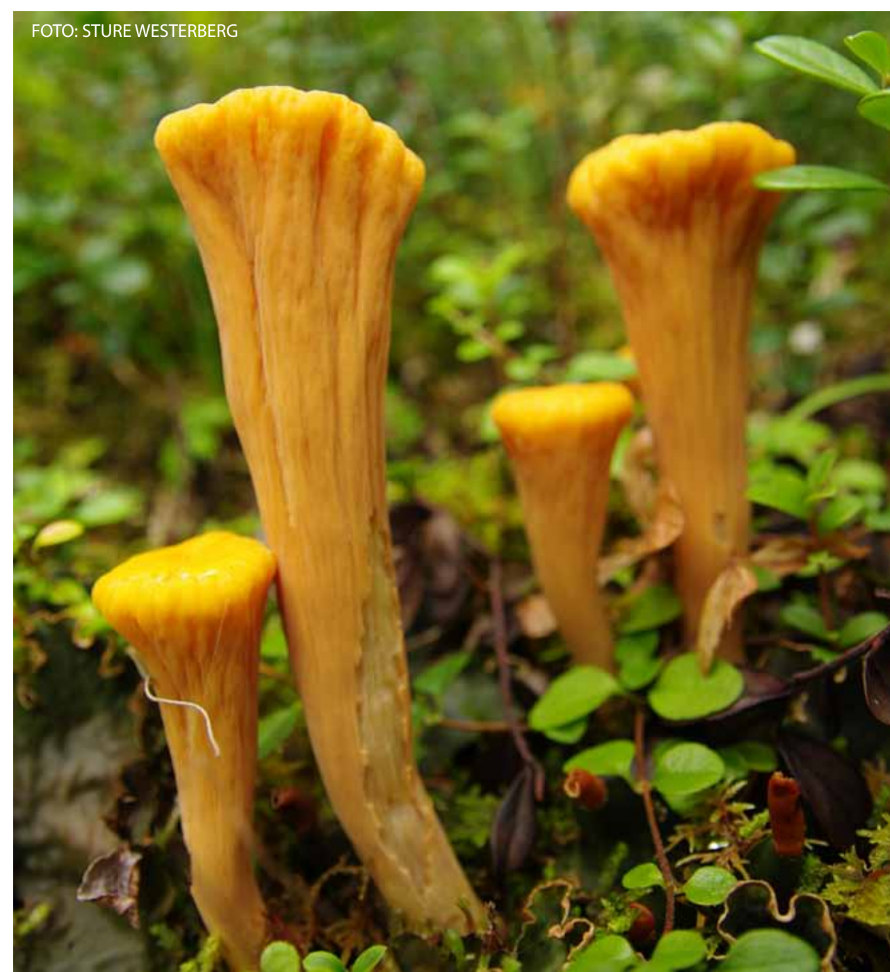
Flattoppad klubbsvamp. Club Coral.