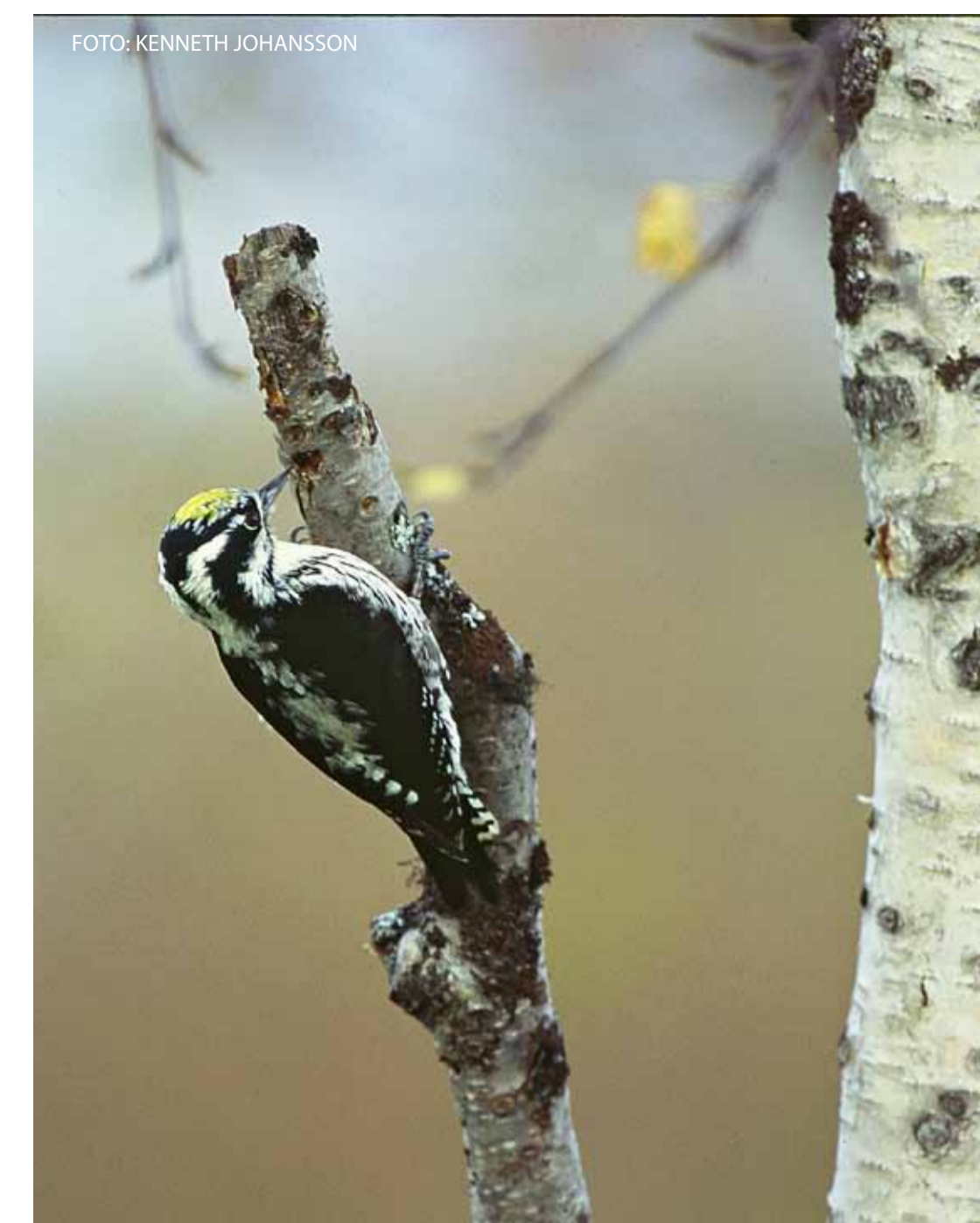
Tretåig hackspett. Three-Toed Woodpecker.