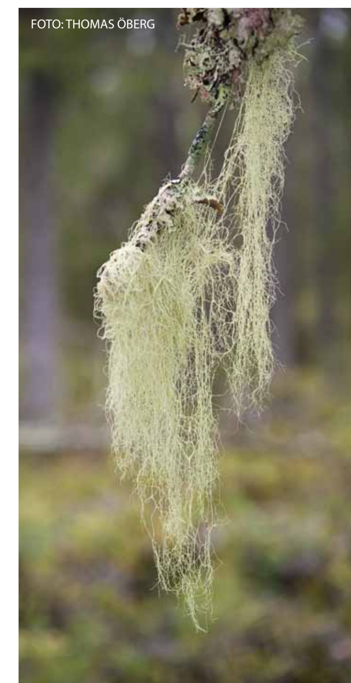
Garnlav. Witch's Hair Lichen.