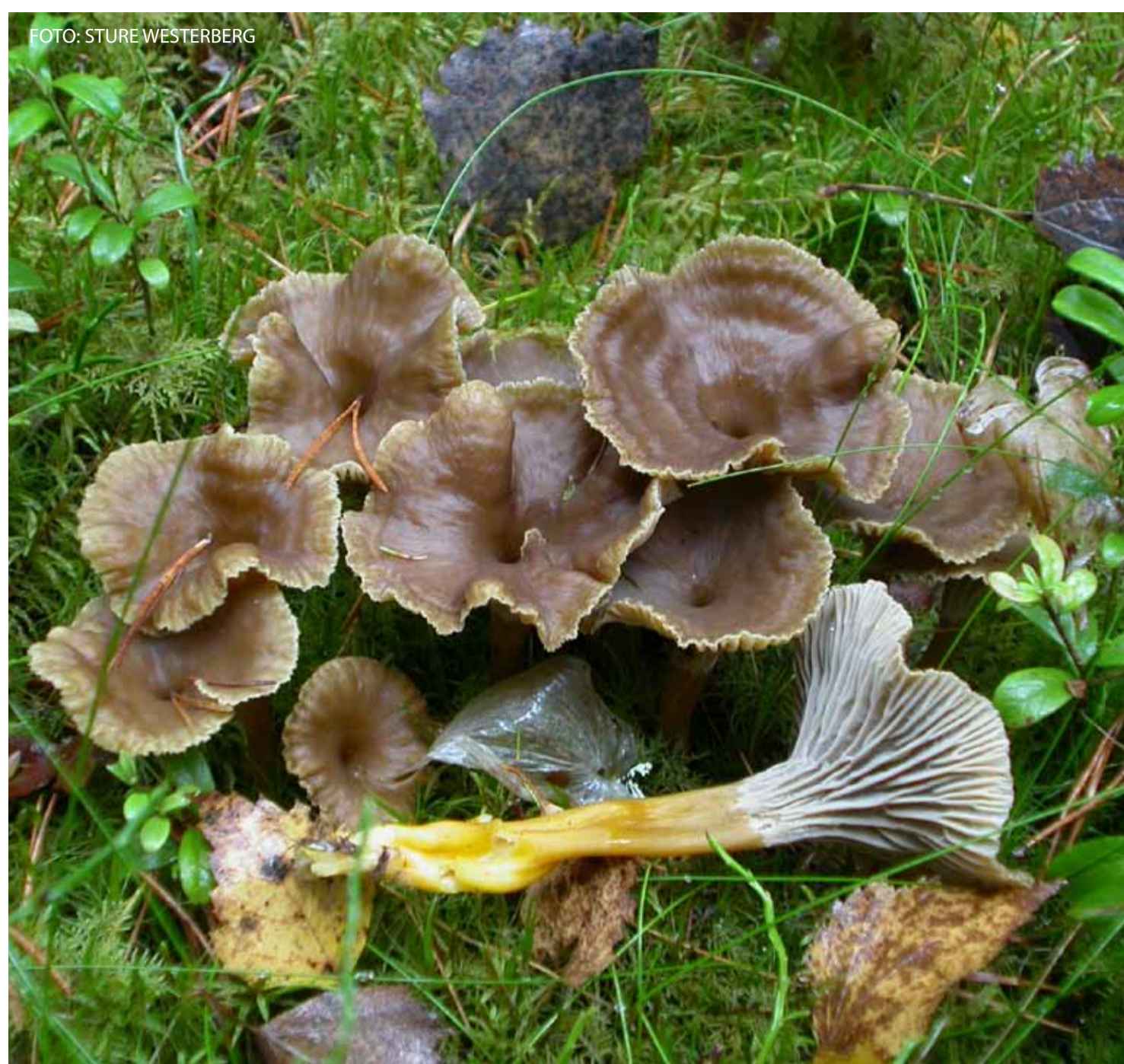
Trattkantarell. Funnel Chanterelle.