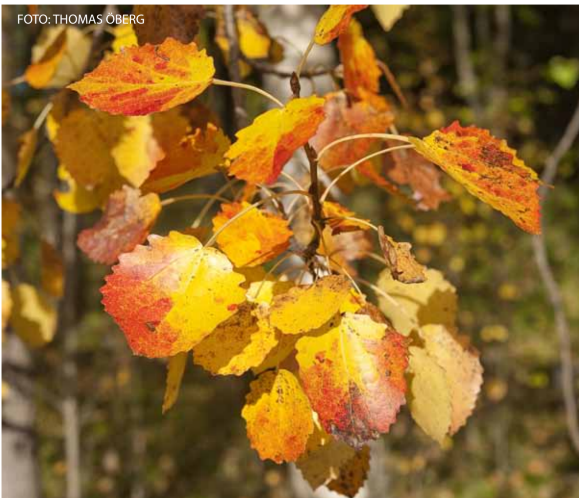
Asp i höstfärger. Aspen in autumn colours.