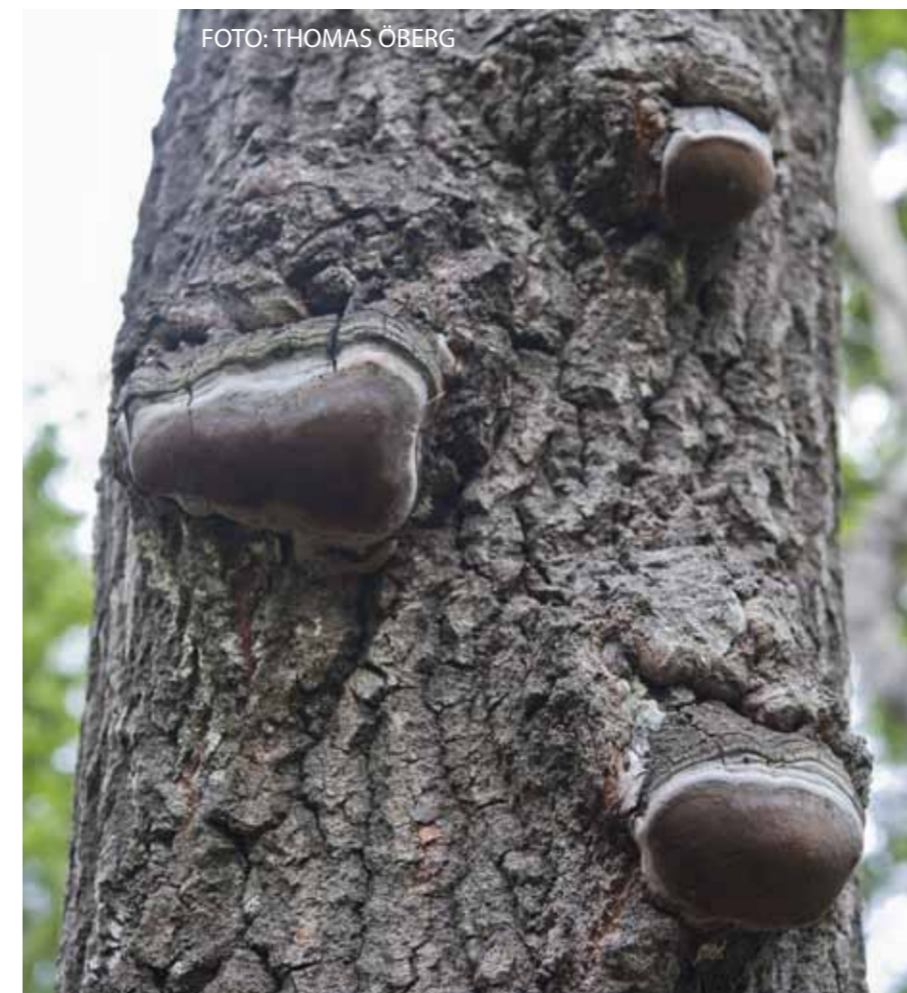
Aspticka, en parasit på asp. Aspen Polypore, a parasite on aspen.