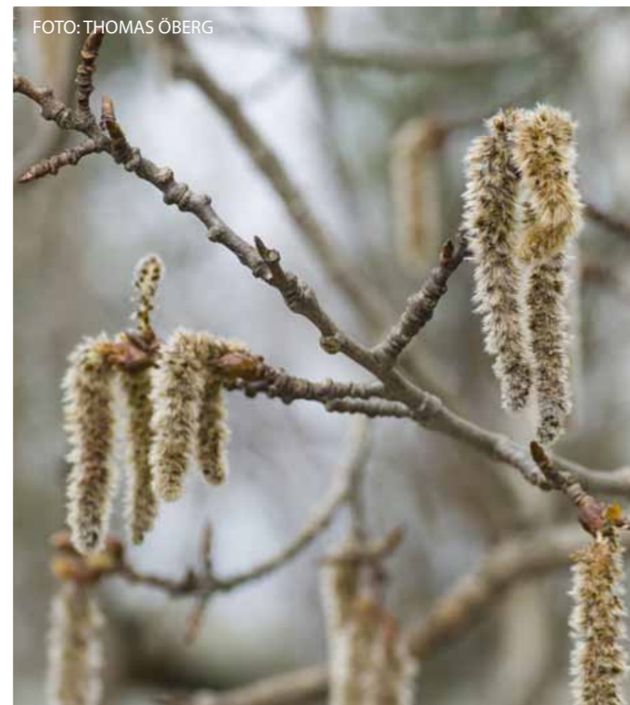
Aspen blommar med långa hängen. Aspen blooms are long catkins.