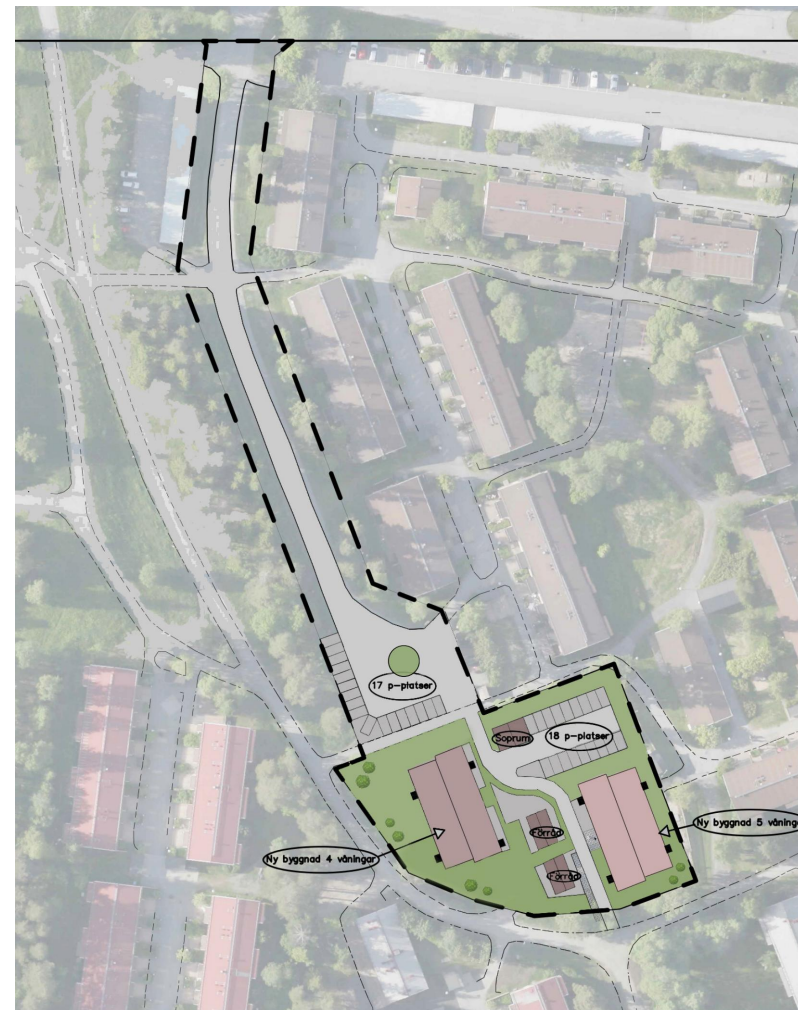
ILLUSTRATION (exempel på hur det kan komma att se ut)

*Kartälligheter Luleå kommun Utdrag ur primärkartan 2016*