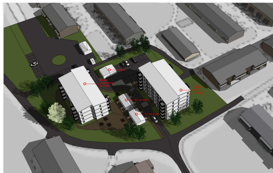
ILLUSTRATION (exempel på hur det kan komma att se ut, Arkitektuset Monarken)