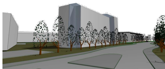
Vy från Mjökuddsvägen mot Tuna