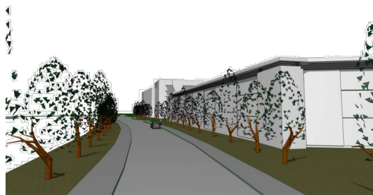
Vy från Mjökuddsvägen mot Mjökuddscentrum