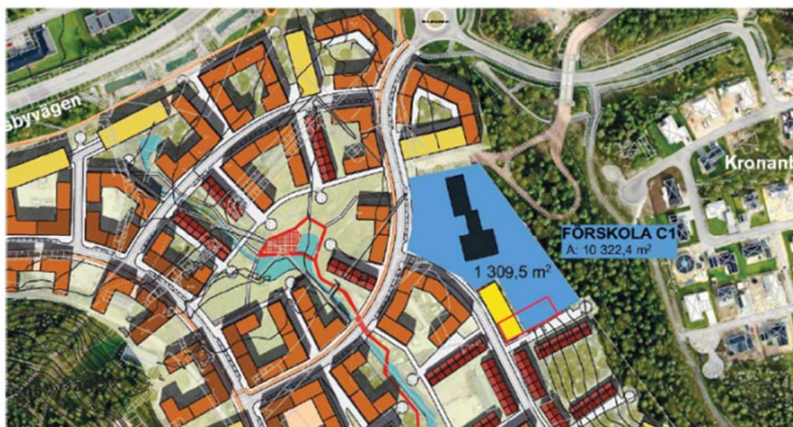
Ytbehov illustrerat för alternativt läge C1

Beställaren vill i stället att vi går vidare med förslag C1 och vrider P-huset så att det inte skuggar tomten lika mycket. Förslaget öppnar för att bygga in det i slänten som ett souterräng-p-hus.