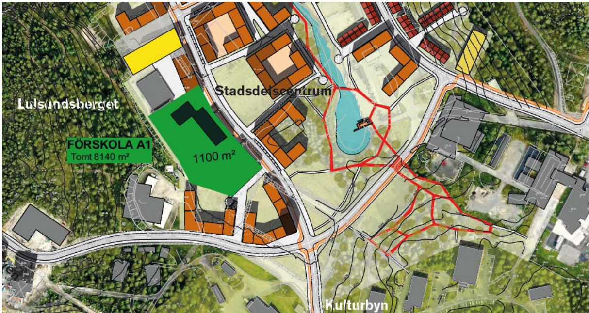
Ytbehov illustrerat för alternativt läge A1.