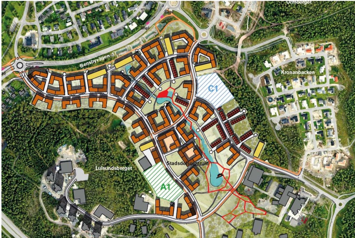
Översikt Illustration av ytbehov för alternativ A1 och C1.

Skalenliga skisser redovisas som bilagor.