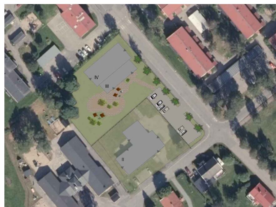
ILLUSTRATION (ej skalenlig)