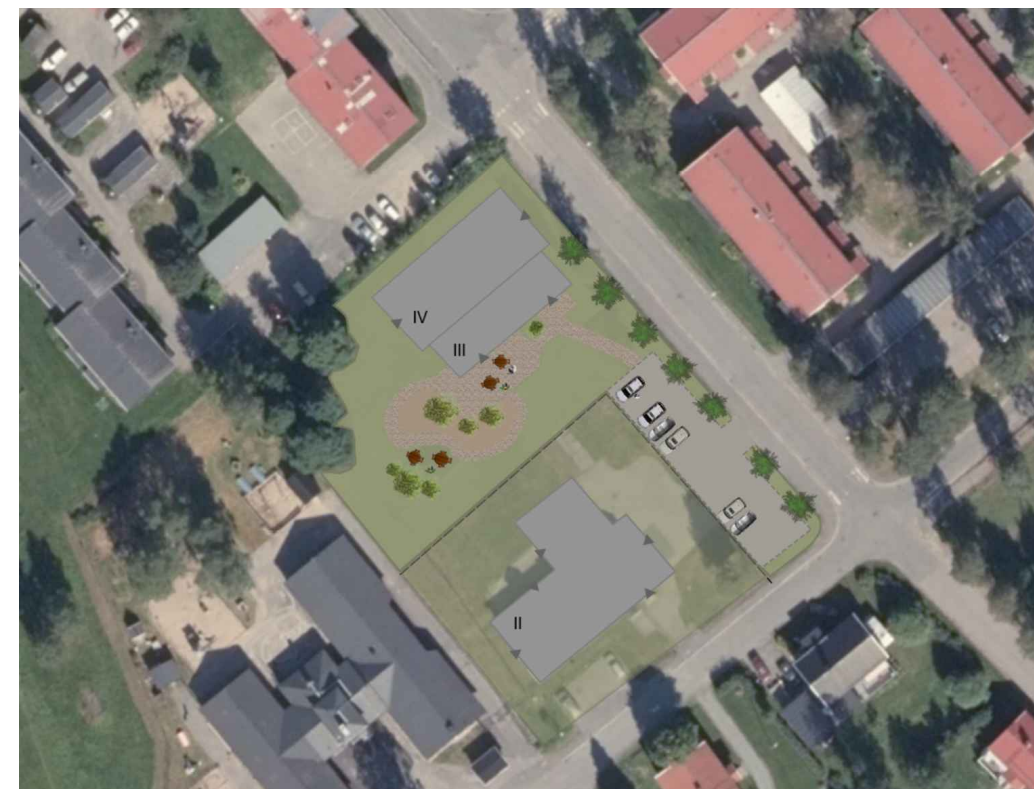
ILLUSTRATION (ej skalenlig)