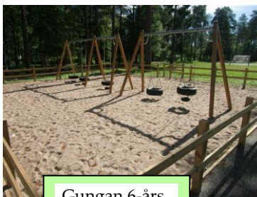
Gungan 6-års och Lillfritids