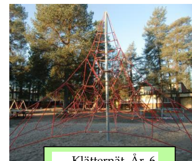
Klätternät År 6

När eleverna i respektive klass har räknats in går klassansvarig till brandansvarig eller hans ersättare som står vid ingången till gymnastiksalen och meddelar om deras elever är ute från skolan.