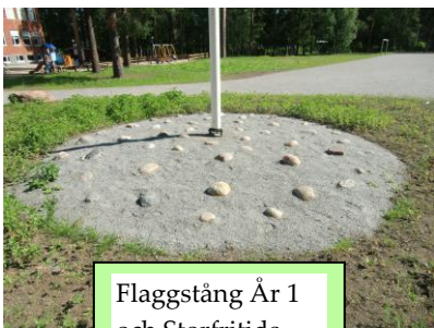
Flaggstång År 1 och Storfritids

När eleverna i respektive klass har räknats in går klassansvarig till brandansvarig eller hans ersättare som står vid ingången till gymnastiksalen och meddelar om deras elever är ute från skolan.