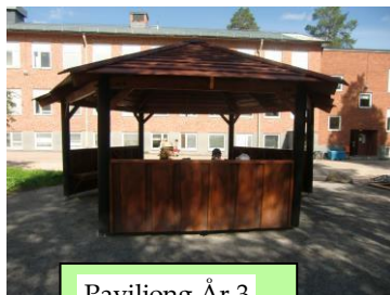
Paviljong År 3