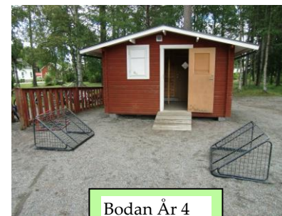
Bodan År 4