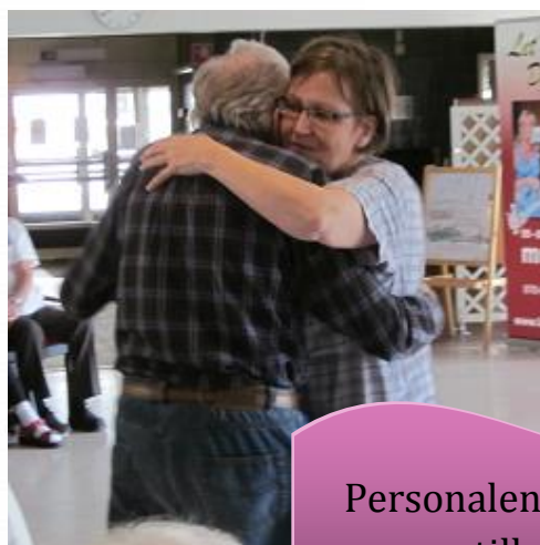
Personalen bjuder upp till dans