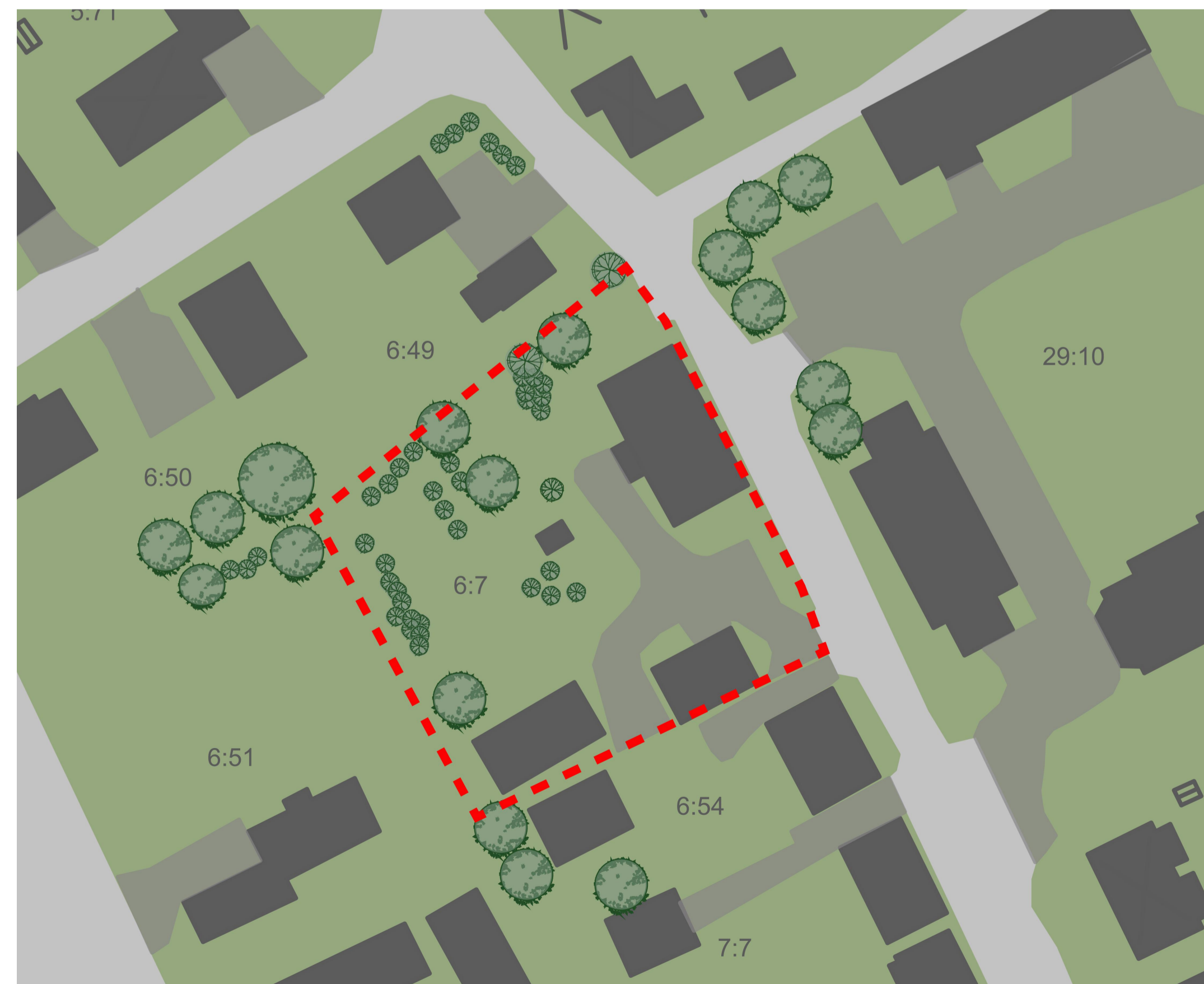
ILLUSTRATION (ej skalenlig)