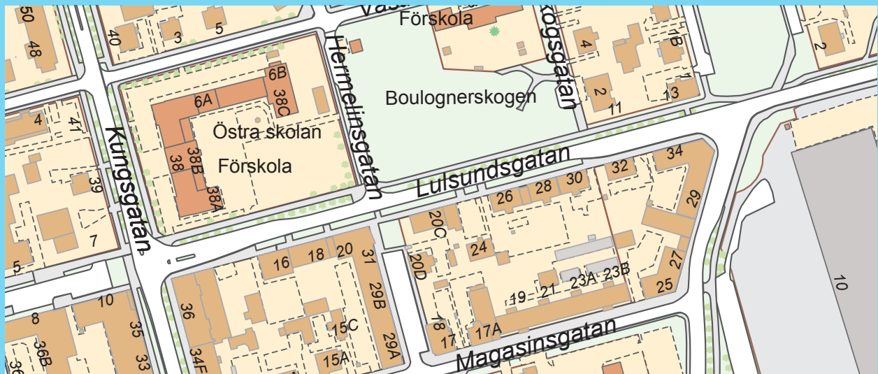
Vid adressättning tillämpas huvudregeln att husen på vänstra sidan av en gat skall ha udda nummer och att husen på den högra sidan av gatan skall ha jämna nummer. Väster och höger räknas då i färdriktningen från gatans början.