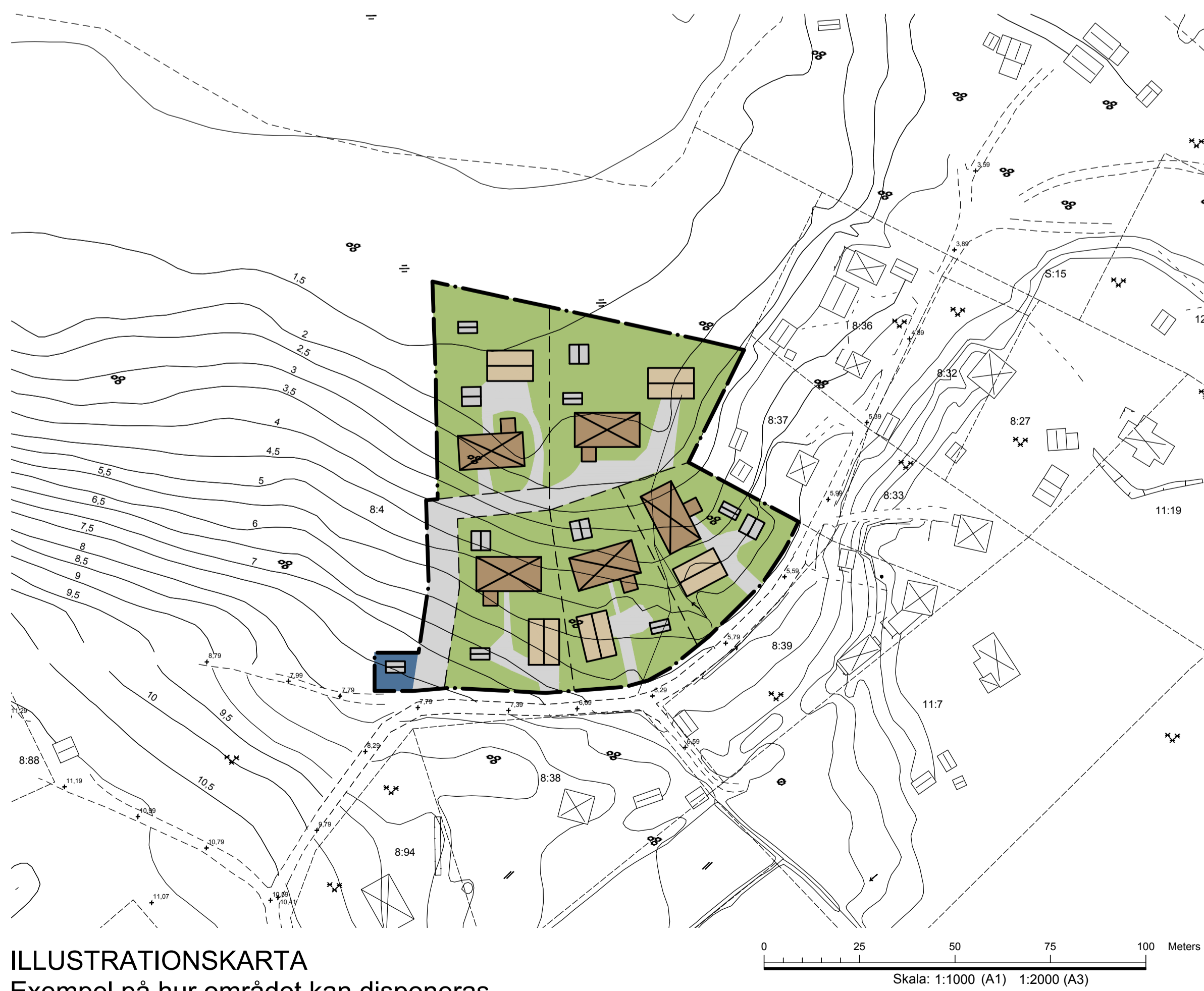
ILLUSTRATIONSKARTA Exempel på hur området kan disponeras