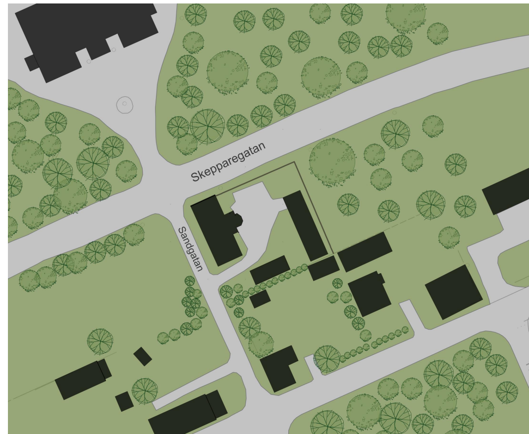
ILLUSTRATION (ej skalenlig)