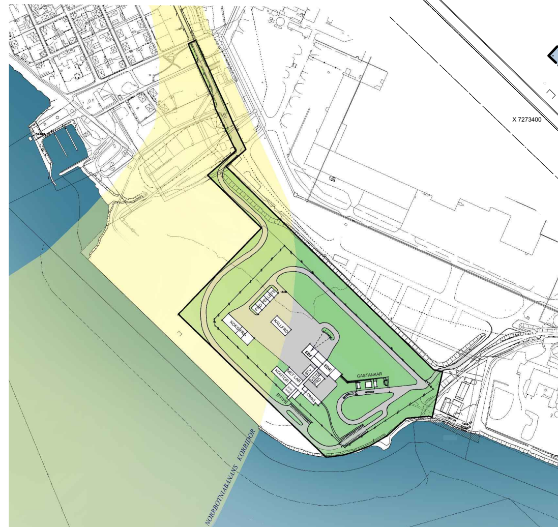
Illustration över möjlig disposition av planområdet, skala 1:4000 (A1)