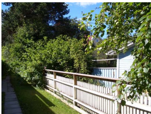
Tomtgräns mot Rådjuret 6

Stadsbyggnadskontoret föreslår byggnadsnämnden besluta att godkänna detaljplanen utan ändringar och föra den vidare till kommunfullmäktige för antagande.