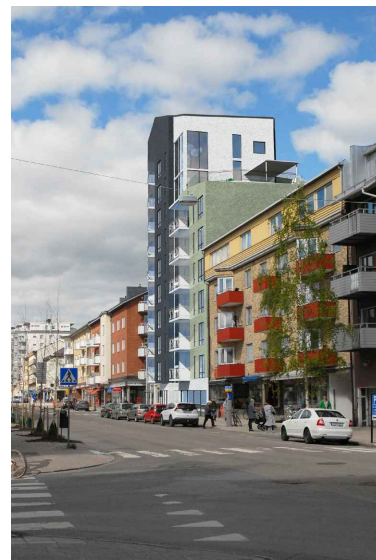
Vy från Stationsgatan