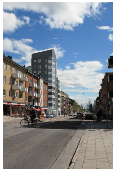
BILDMONTAGE Vy från Storgatan

Genomförandetiden är 5 år från den dag planen vinner laga kraft