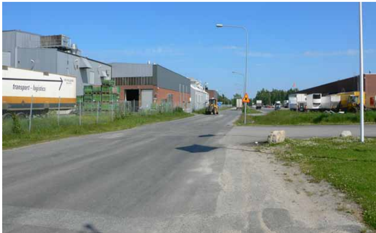
Traktorvägen. Bild österut mot Ferruform och Coop omlastning.

Planområdet är en del av Luleå tätort, som öster om väg E4 är av riksintresse för turism och friluftsliv, främst rörligt friluftsliv, enligt 4 kap 2 § miljöbalken.