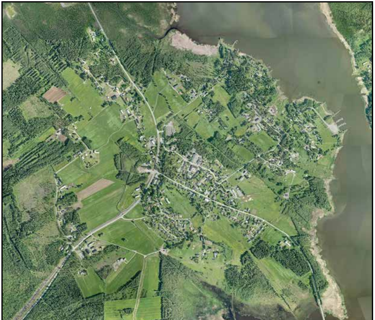
Flygfoto över Bensbyn

- Odlingsbar jord tas i anspråk för bebyggelse