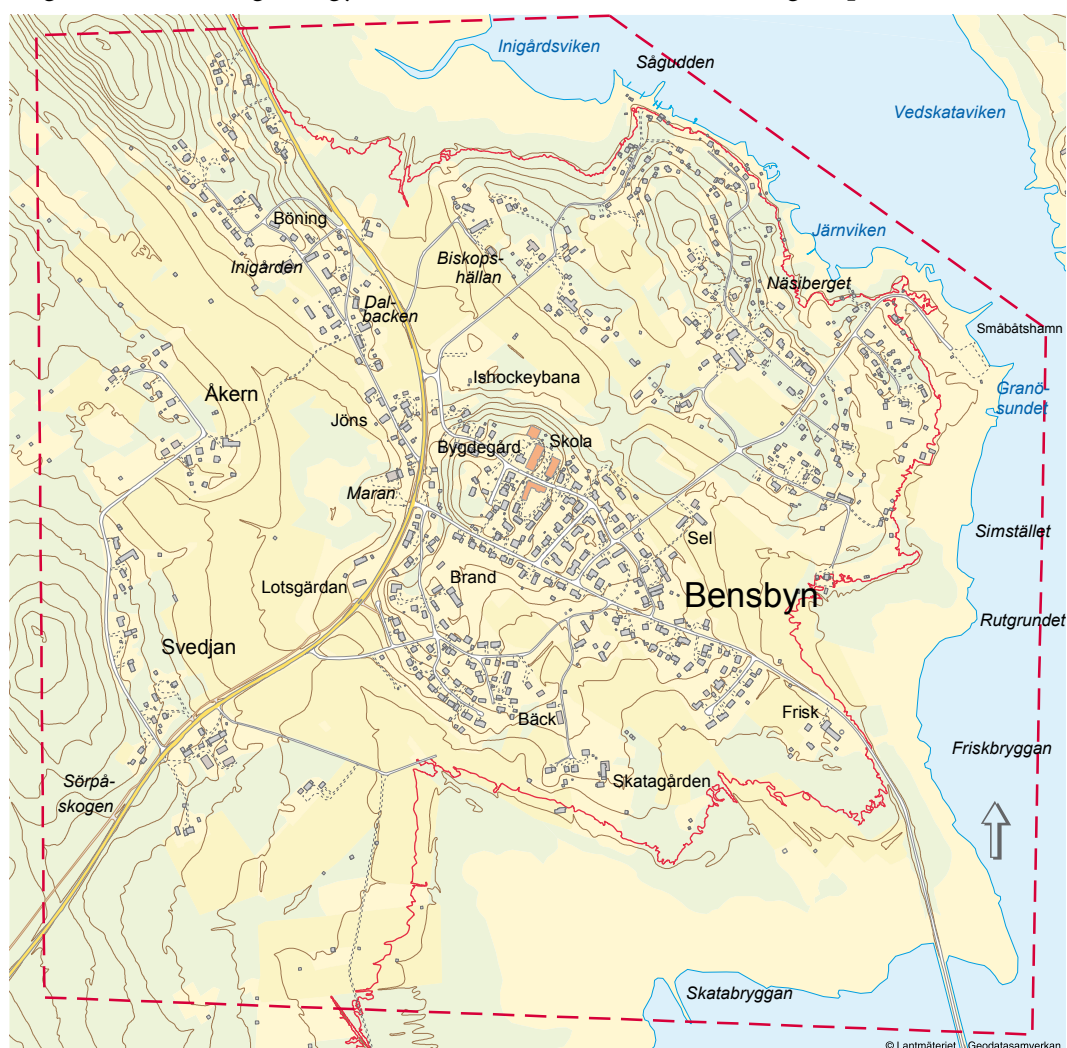
Topografin beskrivs med höjdkurvor. Nivån + 2.5 m ö h markerad med röd linje.

Lokalklimatet inom planområdet präglas i första hand av topografin/terrängen i samverkan med vegetation och bebyggelse. Inom planområdet varierar markhöjden från 0 till drygt 23 meter över havet (se karta nedan). Dessa terrängförhållanden styr till stor del lokalklimatets egenskaper, där högre belägna markområden är mer utsatta för vind och lägre mer skyddade. Samtidigt är lågpunkter mer utsatta för kallluft vintertid, med åtföljande högre energiförbrukning och delvis sämre boendekvalitet. Sluttningsområden som exponeras mot söder får högre solinstrålning och gynnsammare lokalklimat än nordligt exponerade sluttningszoner.