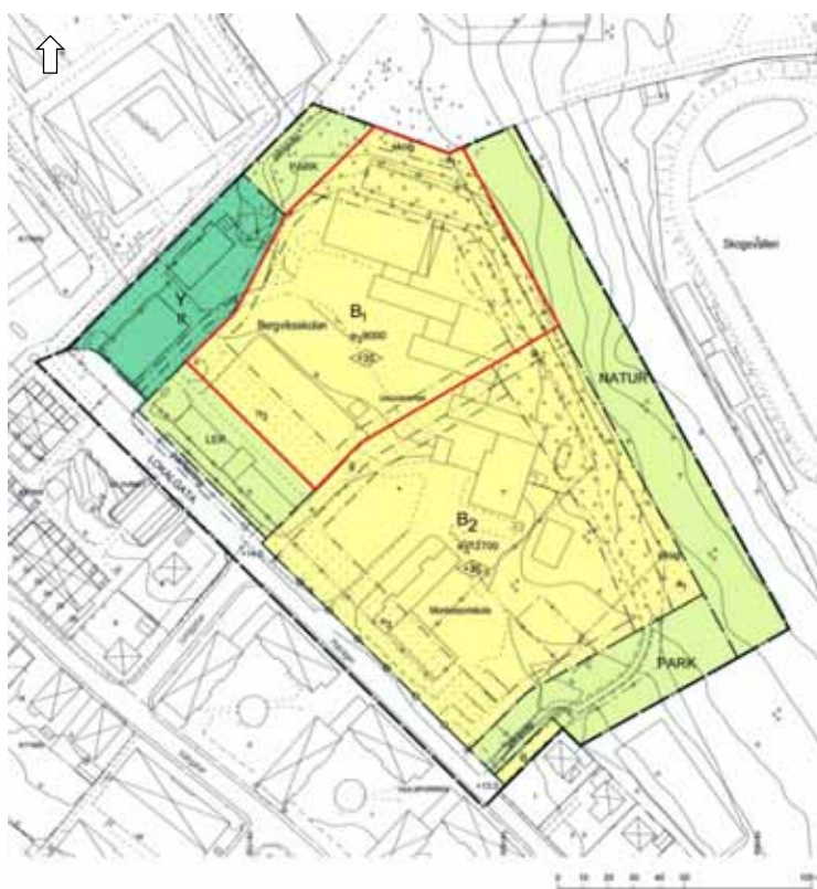
Gällande plankarta för detaljplan (PL 349)

Kommunstyrelsens arbetsutskott beslutade 2016-10-10 § 314 att ge stadsbyggnadsnämnden i uppdrag att ändra ursprunglig detaljplan.