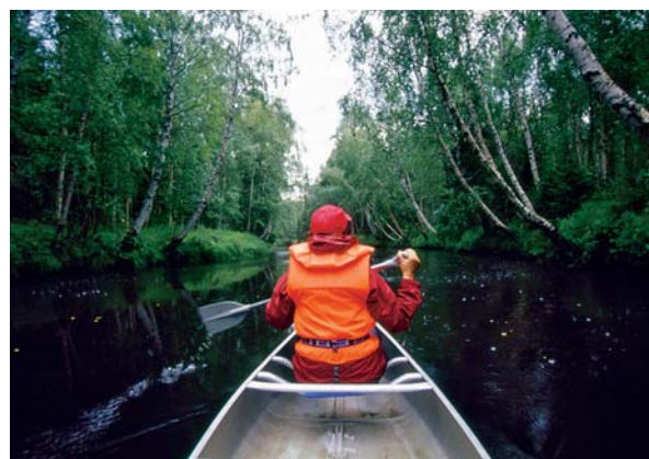
Paddeltur i Vitån

Den stora naturguiden till pärlor i Luleå kommun säljs i Stadshuset och på bokhandlar i Luleå, pris 250:-