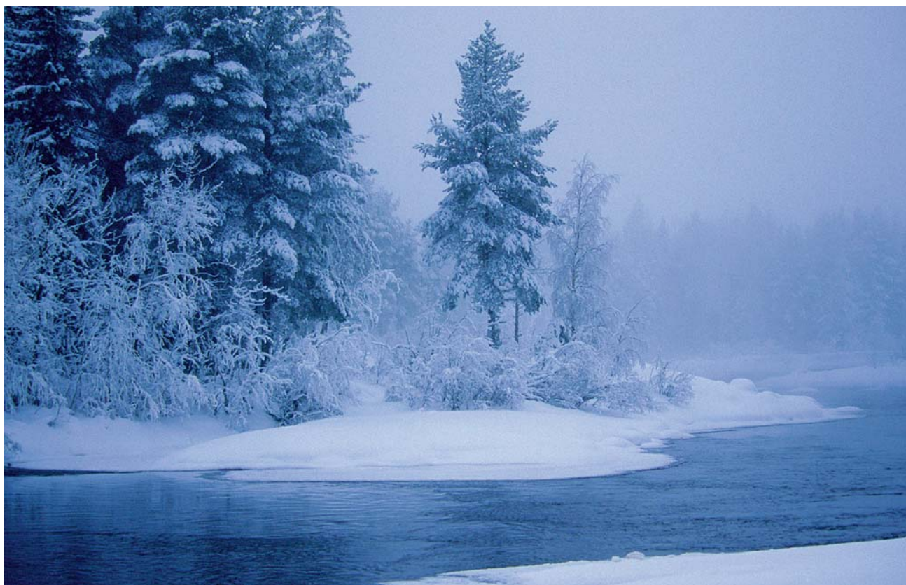
Vinter längs Råneälven. Se upp för svaga isar.

Den stora naturguiden till pärlor i Luleå kommun säljs i Stadshuset och på bokhandlar i Luleå, pris 250:-