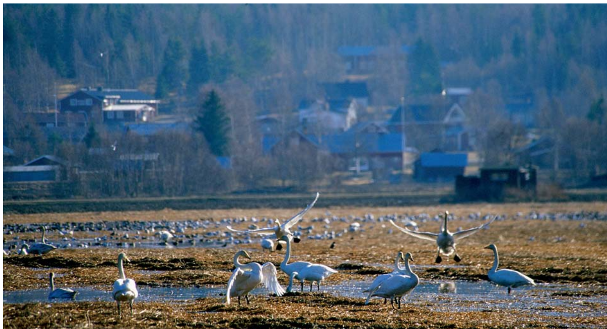
Sångsvanar på odlingsmarkerna i Alvik

Den stora naturguiden till pärlor i Luleå kommun säljs i Stadshuset och på bokhandlar i Luleå, pris 250:-