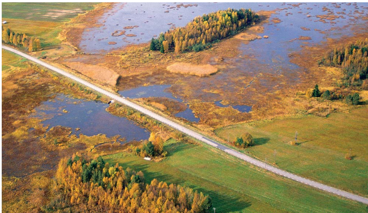
Möröbanken, efter att fotot har tagits har ett nytt fågeltorn uppförts på platsen

Den stora naturguiden till pärlor i Luleå kommun säljs i Stadshuset och på bokhandlar i Luleå, pris 250:-