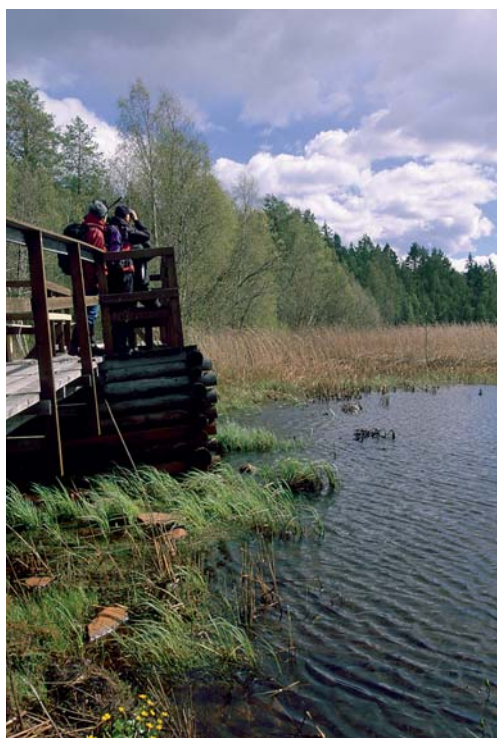
Fågelskådning vid Gammelstadsviken

Följ gamla Haparandavägen från Luleå förbi universitetet mot Rutvik. Från vägen finns en skyltad avfart västerut mot Gammelstadsviken och parkeringsplats. Härifrån finns markerade och spångade stigar till fågeltorn och fågelskådarbyggnad. Från fågeltornet går en trevlig markerad vandringsled ända till Hägnan vid Gammelstad. Det går förstås att vandra in i området från detta håll. Längs leden finns flera fina ställen för utblick över Gammelstadsviken. Här finns även kulturhistoriskt intressanta platser som kallkällan vid Smörberget, där bondekvinorna förr sköljde smöret före försäljning och Köpmanhällan, där segelfartygen kunde förtöjas.