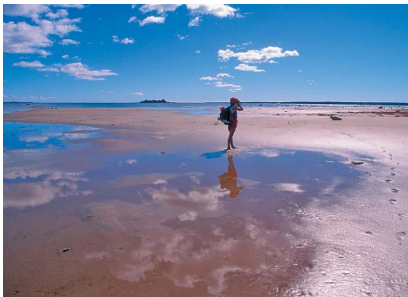
En av Sandöns långgrunda sandstränder

Mitt på ön ligger Sandögårdarna, en jordbruksby med flera vackra norrbottensgårdar. Här slås fortfarande valarna.