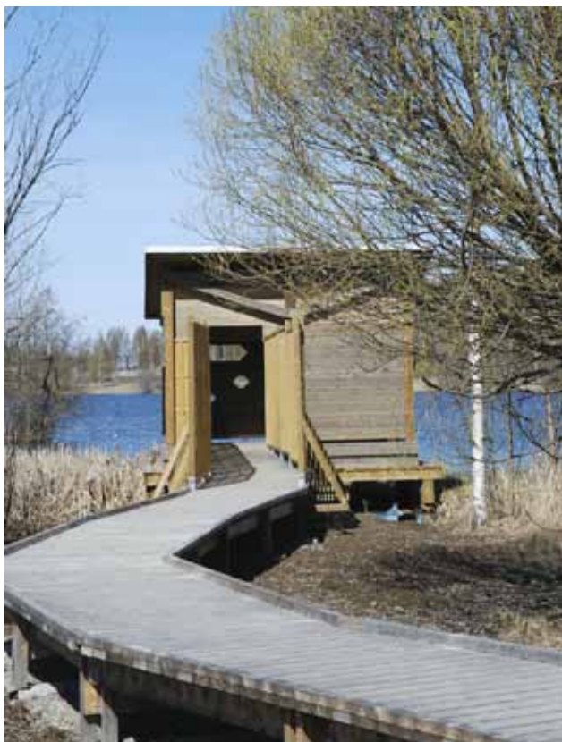
Gömsle med landgång