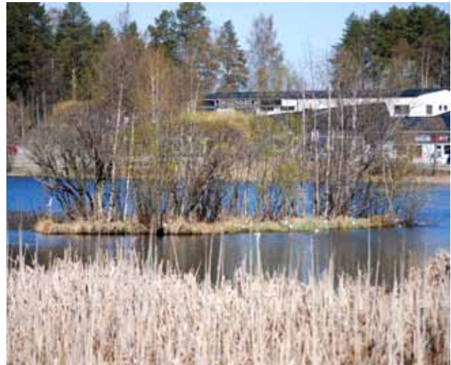
En av tjärnens konstgjorda öar

Luleå kommuns tekniska förvaltningen kommer att ansvara för områdets skötsel och förvaltning i framtiden.