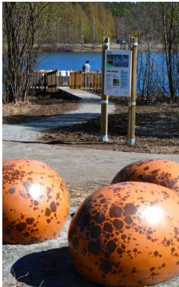
Samlingsplats med ägg, entréskylt och brygga

Samlingsplats för förskolor/skolor med ägg finns i norra delen av tjärn i närheten av angoringsplats för buss och gång- och cykelväg från Mjölkudden.