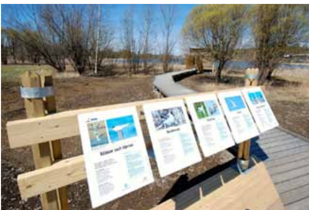
Informationsplats "Måsar och tjärnor"

Totalt har tre stora informationsskyltar i A1-format placerats vid områdets ”entréer”. Vid fyra platser finns information om de arter som kan hittas vid och i tjärnen. På varje plats finns 3-5 skyltar i A3-format. Totalt har 21 informationsskyltar satts upp. Skyltarna sattes upp under våren 2014.