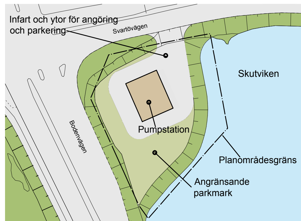
ILLUSTRATION Exempel på hur området kan komma att disponeras