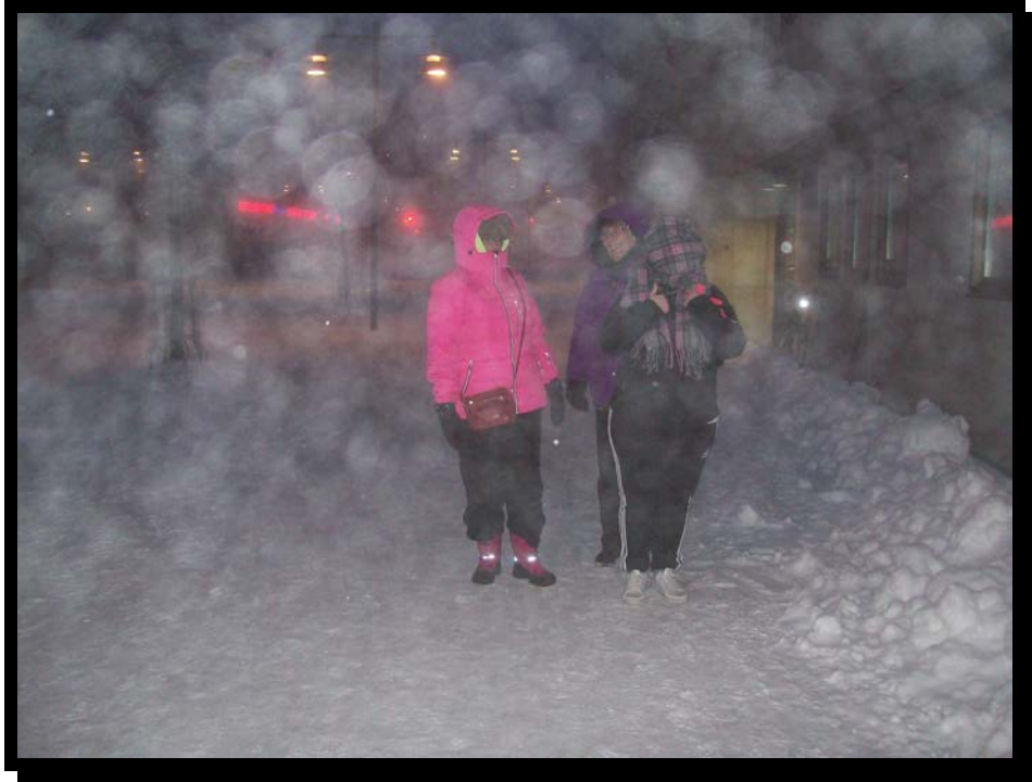
En uppfriskande promenad i snöstormen.