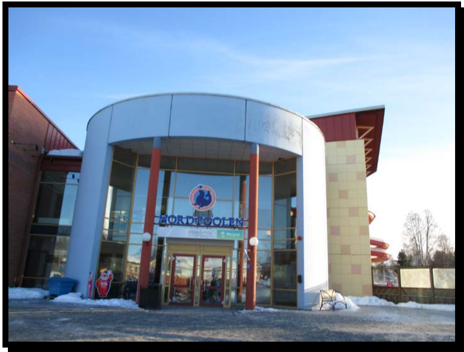
På helgerna åker vi ofta iväg på aktiviteter som ungdomarna önskar,,,denna lördag blev det ett besök på Nordpolen i Boden.