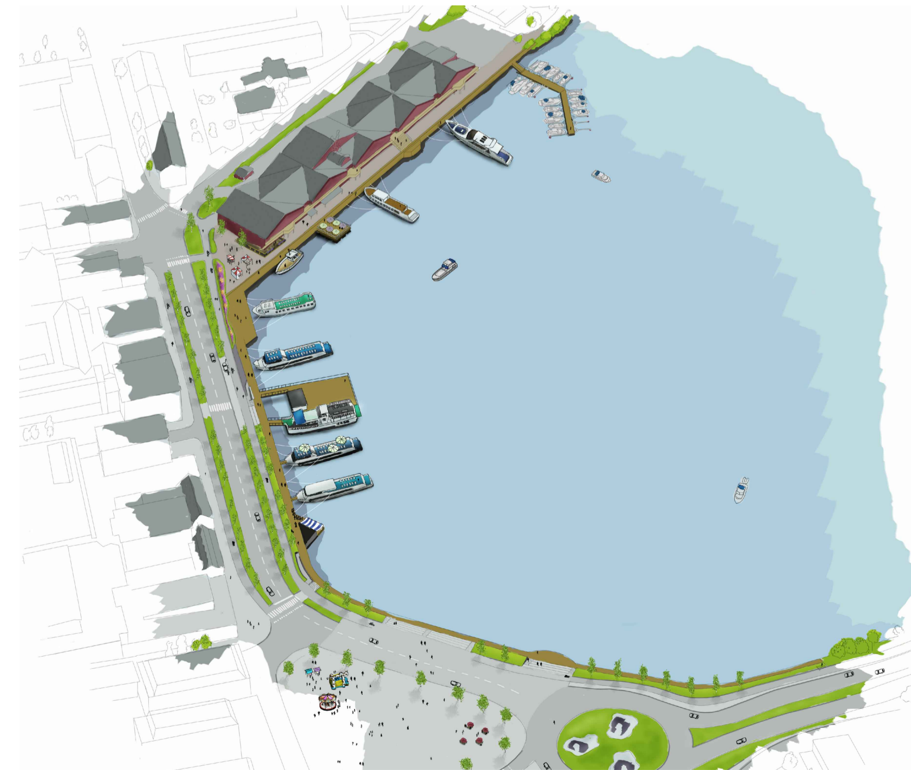
ILLUSTRATION ÖVER HAMNOMRÅDET (ej skalenlig)

Illustration till vänster är framtagen i samband med kommunens målbildsarbete för Norra hamn. Observera att detta är ett scenario som detaljplanen kan medge, och att det kan komma att se annorlunda ut. Detaljplanen innebär inga förändringar för kringliggande gator.