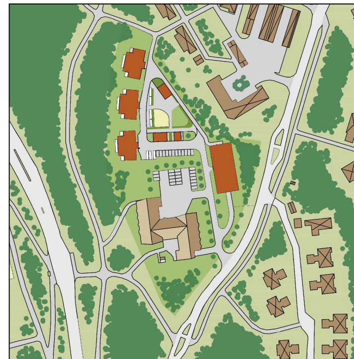
ILLUSTRATION (ej skalenlig) Exempel på huområdet kan komma att disponeras