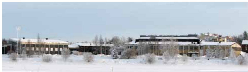
Översiktsbild av hela Pontusanläggningen.

– Ja, så är det. Pontushallen kommer att vara stängd under stor del av året, redan i februari stängs källaren, A