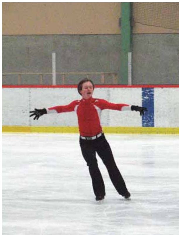
Träningspass i Coop Arena.

Han fick sin internationella seniordebut med en