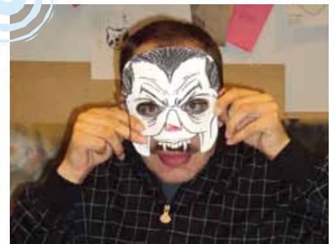
Många fina vampyrmasker tillverkades.

Läs mer om Blixten's fritidsgård på www.lulea.se/blixten