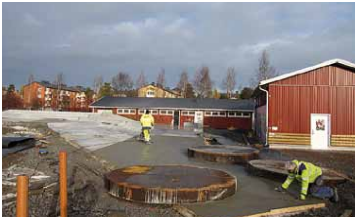
Sista gjutningen av golv inför vintern, tredje manualpaden placerad.

Line Parks till Luleå för att slutföra den 400 kvm stora bowlsektionen. Målsättningen är att den ska vara klar i juni-juli 2011.