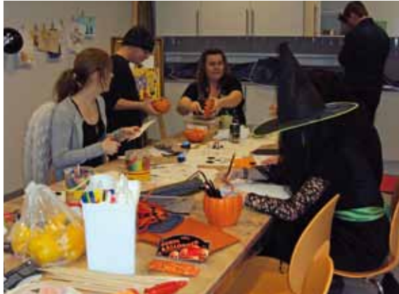
Halloweenpysslandet är i full gång.

spel och i fiket hade många parkerat sig med Yatzy, 4 i rad, Memory och andra lättsamma sällskapsspel. Det hela blev en riktigt lyckad och trevlig