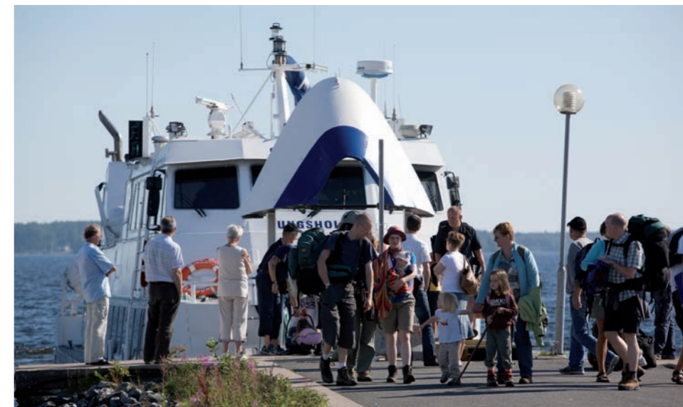
Avstigning från M/S Kungsholm i Södra Hamn

Luleå är en spännande sjöstad med en rad aktiviteter sommartid. Staden, som omges av vatten, lever alltid upp när isarna och vinterkylan släppt sitt grepp. Missa exempelvis inte Luleåkalaset som i år går av stapeln mellan 31 juli och 2 augusti. Kalaset kan med fördel besökas bätledes med gästplatser i både Norra och Södra Hamn. Fem onsdagar i juli anordnas musikkvällar på Jopikgården, Hindersön. Klubbviken har ett brett utbud av evenemang, se annonser för detaljer. Missa inte heller vernissagerna på Galleri Agda och Valborg, Junkön, den 14/6 och i galleriet på Brändöskär den 29/6.