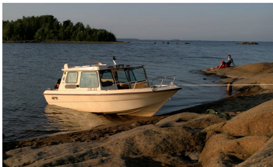
En härlig ankringsplats en ljum sommarkväll

foreningservice@lulea.se Tack för hjälpen!