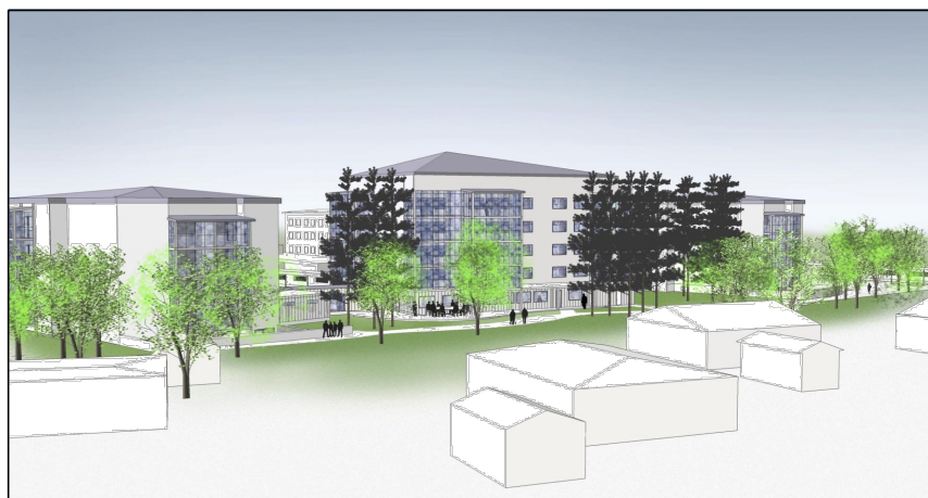
ILLUSTRATION (Arkitekthuset Monarken AB)

Grundkarta: Gammelstad, del av Stadsön 2:135 Upprättad: 2014-09-24 Kartan är upprättad genom utdrag ur Luleå kommuns primärkarta och fastighetskarta