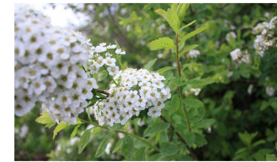
Spirea media "Finn"