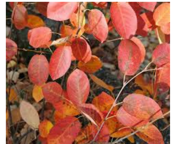
Amelanchier lamarcki, häggmispel i höstfärg