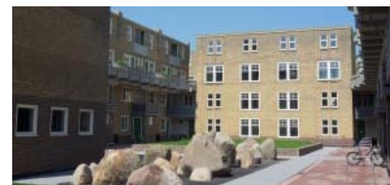
Stenar och block på innergård