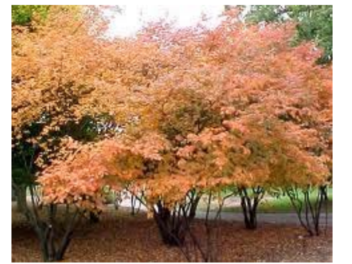
Häggmispel i grupp