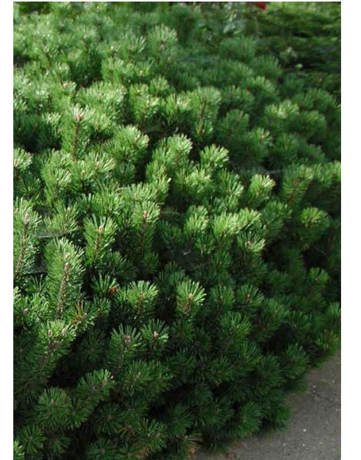
Pinus mugo, låg bergtall