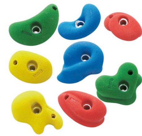
Klättergrepp på klätterberget